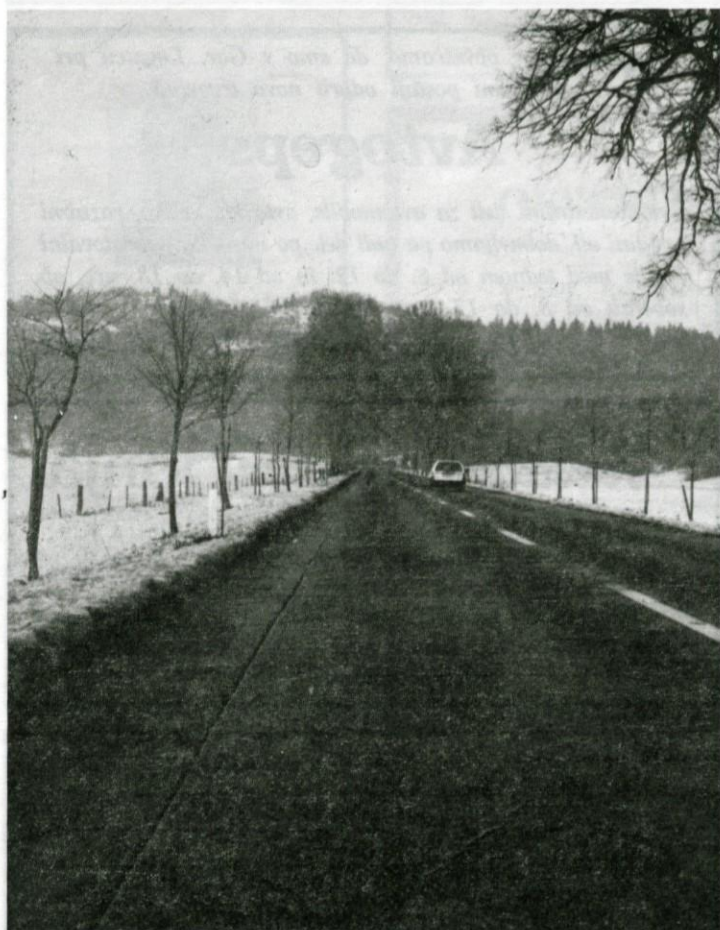
Lipov drevored se po pomladitvi v letu 1988 dobro obrašča