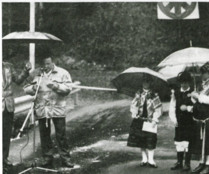
Predsednik IS SO Logatec med govorom ob otvoritvi