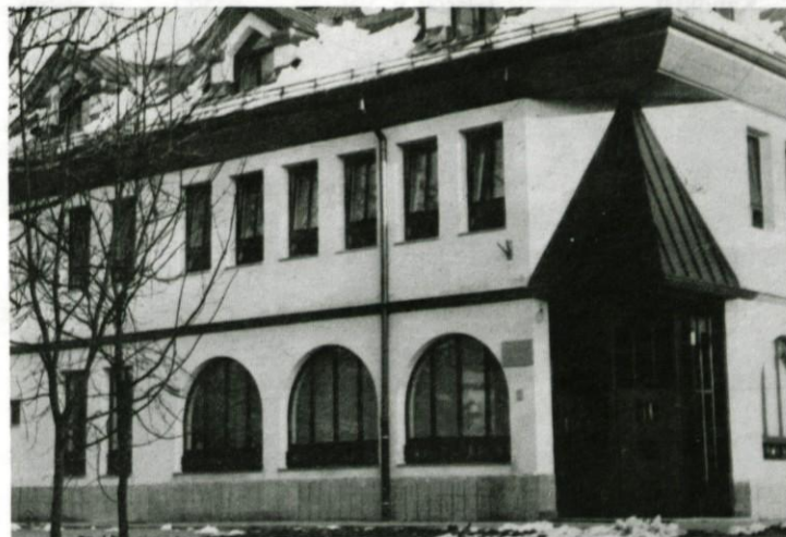
Novi prostori za SDK (Foto J.G.)