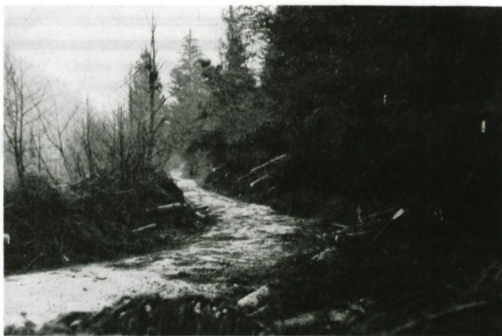
Podrta drevesa ob cesti v Žejno dolino

S priznanji bodo nagrajene tudi inovacije s področja industrije in obrti, ki jih bodo posamezni člani komisije za inovacije ocenili kot najboljše.