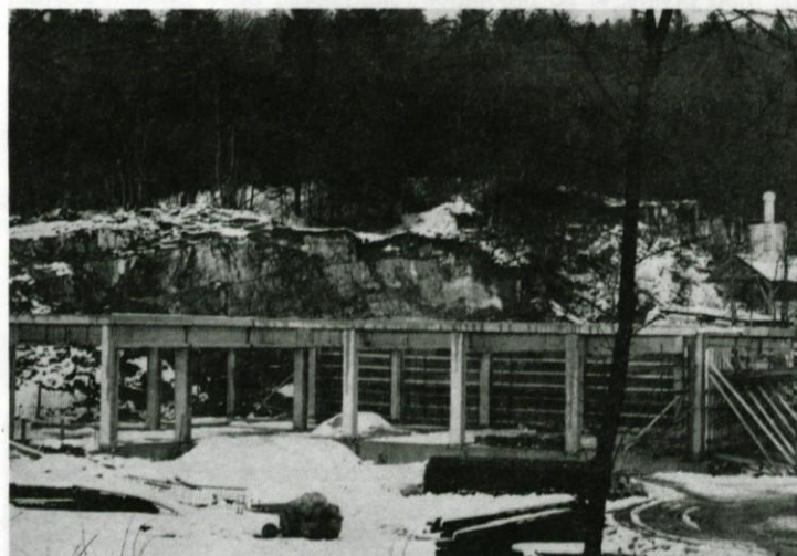
Gradbišče nove cestne baze v Zapolju