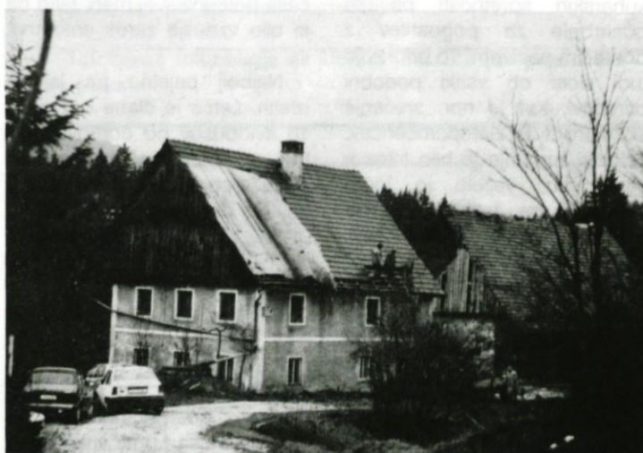
V Novem svetu je odkrivalo strehe