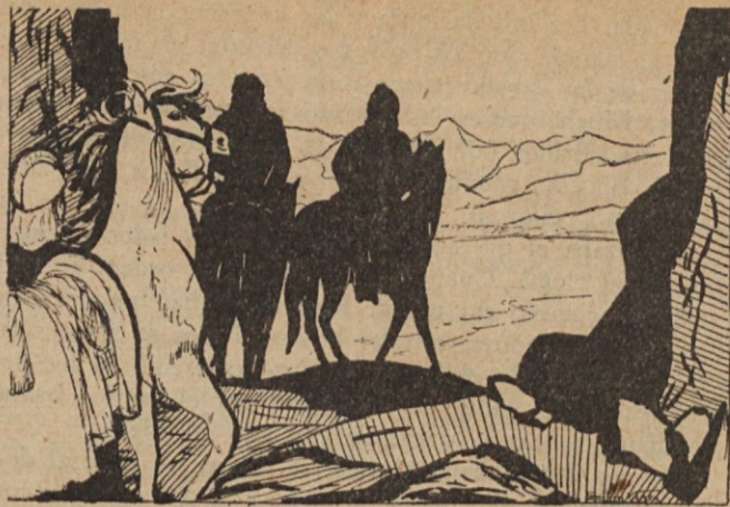
Iztok, ordenó ir hacia el valle...

“¿No oyeron nada durante la noche?”, inquirió Iztok.