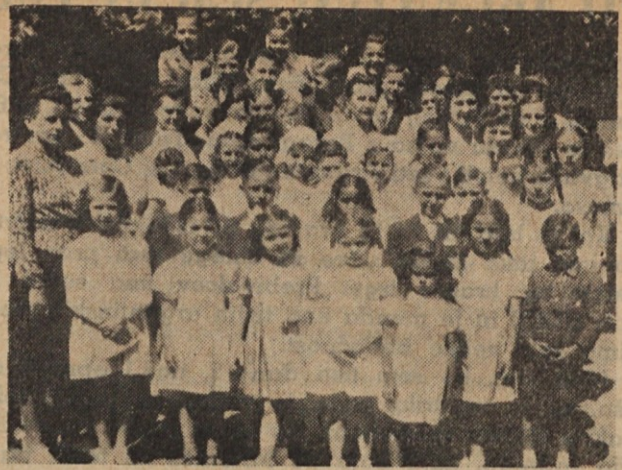
Los niños de la Colectividad hicieron su Primera Comunión el 17 de Diciembre. Naši mali na dan Prvega sv. Obhajila

Voznik je ustavil in me opozoril: tukajle je hiša Breitegger. Zares. Saj mi je že tudi gospa Lija ponudila roko v pozdrav. Med tem, ko je njena prijateljica sprejemala od voznika neke zavoje, je mene gospa Lija spremila proti hiši, vsa vesela, da more po dolgem času spet slovensko besedo spregovoriti in sprejeti prvega slovenskega rojaka pod svojo streho. Njen mož je dunajčan, ki sicer zna nekoliko slovensko, toda ker je tamkaj največ ljudi češkega govorenja, sta se