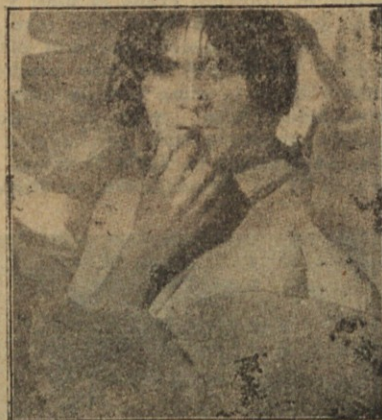
Un joven jibaro