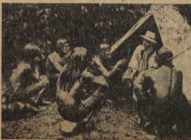
Los jibaros en la lección de Catecismo.

Med tem je ugasnil dan. Veter je razgnal megle, skozi katere so posvetile srebrne zvezde, med katerimi sem iskal veliki in mali voz. Prav nizko na obzorju sem ju našel. V tisti višini, ki je mnogo bolj na severu, se