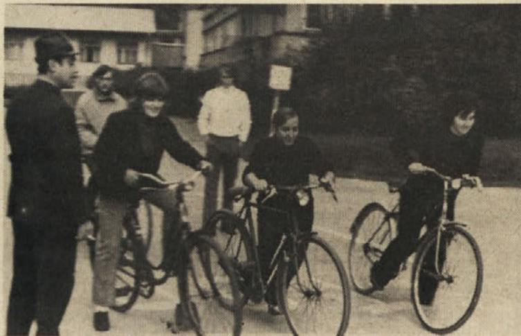
Članice naše kolesarske ekipe na startu

8017 1 4:59. Tako izpadeta iz 1. lige Klima in Izletnik, v 1. ligo pa sta se plasirali ekipi MERX in INGRAD.