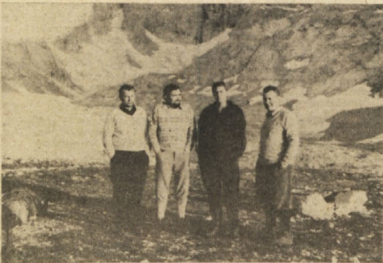
Stirje požrtvovalni udeleženci pohoda na Triglav