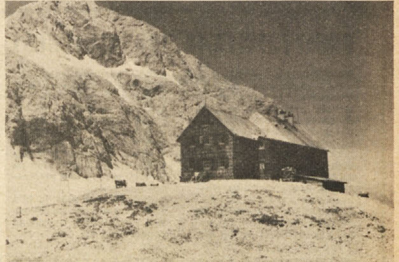
Pogled na planinski dom Kredarica — v ozadju vrh Triglava

Kmalu krenili proti domu pri Triglavskih jezerih. Ta pot je prijetna za noge, saj se na njej kar odpočijejo od prestalih naporov, še bolj prijetna pa je za oči. Rekla bi, da jih imej na tej poti dobro odprte. Tako čudovitega sveta ne vidiš povsod. Prvo triglavsko jezero, kmalu nato drugo in tretje, vmes pa čudovite cvetlice, prijetne vonjave gorskih nageljčkov, modri svišč, rdeč rododendron, pa spet nekaj rumenega ali vijoličastega. Nizki borovci, vidiš celo macesen, čisto ob tleh pa čudovite modre spominčice. Se lepši je pogled na četrto triglavsko jezero. Njegova izredna zelena barva odkriva njegove globine, ponekod bi rekla, da je črno zeleno. Leži malo pod potjo in ob njem so uredili celo počivališča, da si lahko napaseš oči nad toliko lepoto. In tako čudovita je pot vse do kočice pri Triglavskih jezerih, ki je v višini 1683 m. Tu smo malo postali, se okrepčali in nato krenili po poti čez Komarčo pro-