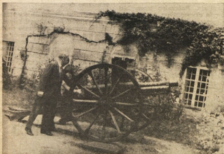
Stari top pred muzejem je vzbudil veliko zanimanje

Izletniki so si v Metliki ogledali metliški grad, v katerem imata svoje zbirke Belokrajnski etnografski muzej in Slovenski gasilski muzej.