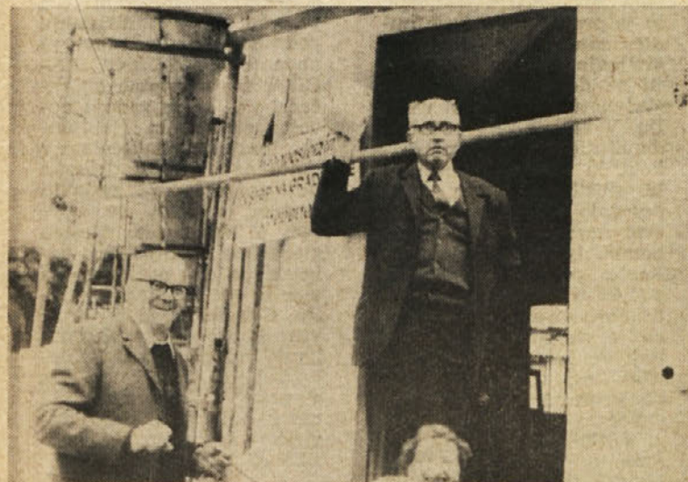
Naša nekdanja sodelavca sta strokovno ocenjevala adaptacijo neke hiše v bližini metliškega muzeja