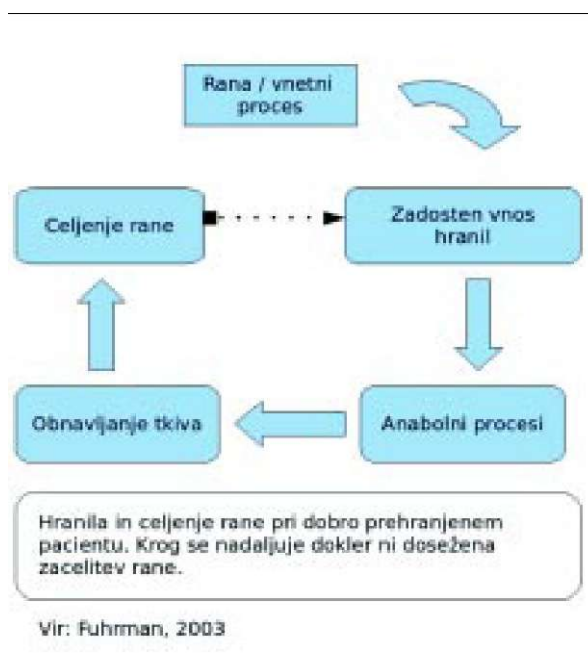
Sl. 1. Hranila in celjenje rane pri dobro prehranjenem bolniku.

oksigencija ter hidracija tkiva (Fuhrman, 2003). Natančnega odnosa med celjenjem rane in prehrano ni možno z gotovostjo oceniti, vendar je vedno več dokazov, da se zaradi pomanjkanja hranil poslabša celjenje rane. Wissing s sodelavci (2001, cit. po Dealey 2005) je v študiji, ki je vključevala paciente z golenjo razjedo, ugotovil, da je bilo stanje prehranjenosti pacientov z nezaceljeno golenjo razjedo bistveno slabše kot pri tistih, ki so imeli golenjo razjedo že zaceljeno. Pri ljudeh, ki so dobro hranjeni, je čas bivanja v bolnišnici krajši, incidenca zapletov je nižja, celjenje ran pa je boljše (Leininger, 2002).