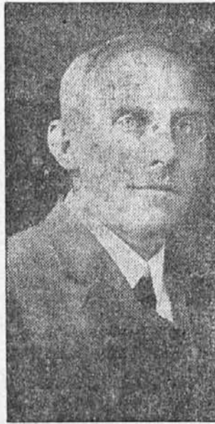
Dr. VLADKO MAČEK

E, na to že deca vejo! Deca že tudi vedo za ono: Česar ne želiš, da drugi tebi