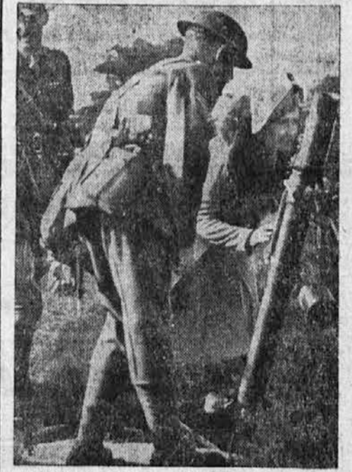
Angleški vojaki preizkušajo nov model orožja.

zna gospa in drugih ne. Že nekoliko utrujena v razglabljanju, nevoljna skoraj upre v Mico oči in reče trdo, hudo, da dekleta zaboli: