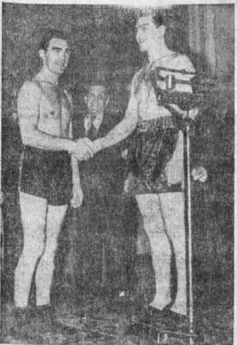
Bivši boksarski prvak Maks Schmelling čestita svojemu nasprotniku.

Diamant z napako je boljši nego navaden kamen brez sija.