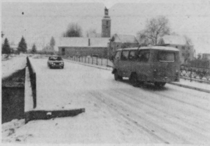
Čez novi most v Vidmu bo odslej promet nemoteno potekal.