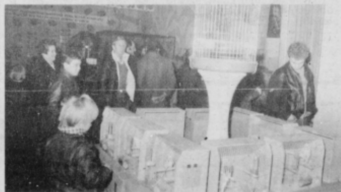
Razstava ptic je bila zelo dobro obiskana.