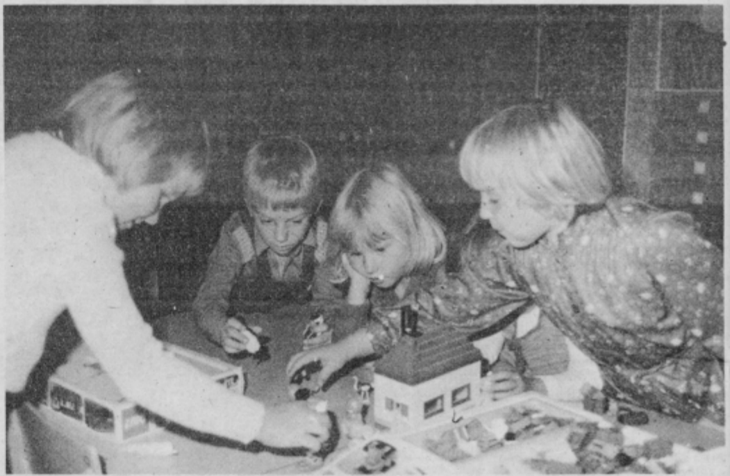
Vsaka igra je za otroke hkrati učna ura!

smotrov in nalog ter razvojnih možnosti otrok. Na vseh vzgojnih področjih — telesnem, intelektualnem in estetskem — je ob načrtnem in celoletnem delu opazen viden napredek otrok v govoru, kar je pogoj in osnova za nadaljnje uspešno delo.