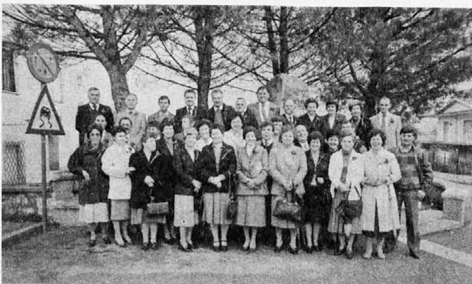
Sovodenski petdesetletniki, ki so svoje srečanje z Abrahamom skupno proslavili letos 20. oktobra

»Na Hrvaškem« nadaljuje dopisnik Borbe, »pripeljejo starši vsako jutro v cerkvene vrtce okoli dva tisoč otrok. Ti se igrajo ob Kristusovih slikah. Pred zajtrkom in kosilom najprej žebrajo (molijo) očenaš in šele nato začne jesti. V splitski nadškofiji se o zakonitosti te dejavnosti niso pripravljali pogovarjati. Pravijo, da starši sami pripeljejo otroke v cerkveni vrtci in da ne delajo razlik med njimi, čeprav so nekateri starši člani partije. Vsekakor se bodo posledice pokazale potem, ko začno otroci hoditi v šolo. Vse tako kaže, da bo za organizirano družbeno vzgojo (beri ateistično, op. ur.) tedaj že dokaj pozno.«