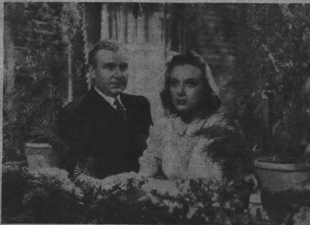
Iz filma »Pesem vetru«. - Kino »Union«.