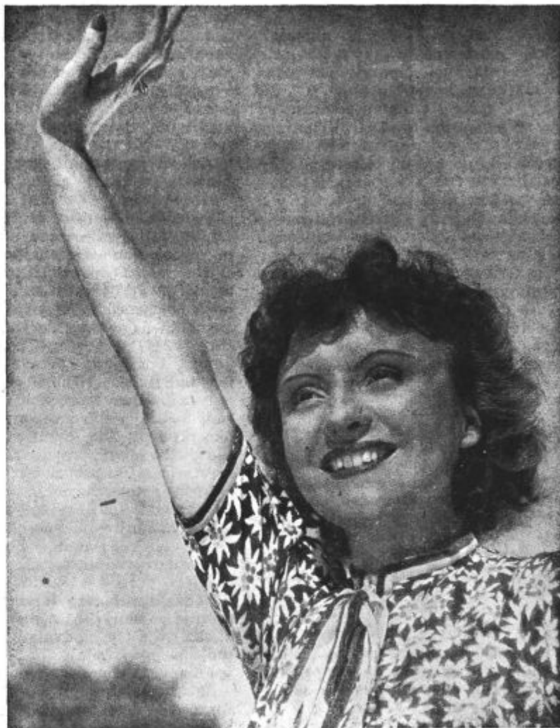
Iz filma »Zastrupljena mladost«. — Kino »Union«.

Chopin je v glasbenem razvoju nad vse zanimiva osebnost, z Mendelssohnom in Schumannom tvori enoto, v kateri je on nujno potreben in vkljub