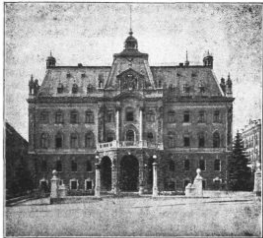
Univerza kralja Aleksandra I. v Ljubljani.

Dne 16. in 17. decembra t. l. bo proslava 20 letnice ustanovitve slovenske univerze.