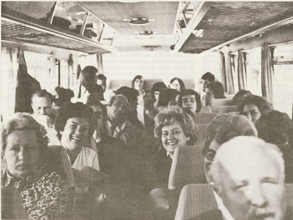
Kljub dolgi in utrujajoči poti je bilo razpoloženje v avtobusih prijetno in je vožnja hitro minila

Čas nas je priganjal in zapustiti smo morali prelepo mesto. Po krajših postankih v restavracijah ob avtomobilski cesti, v katerih smo pustili še zadnje lire, in po kratkih formalnostih na meji smo se pozno ponoči srečno vrnili v Ljubljano. Ostali nam bodo lepi spomini. Mogoče se bodo izpolnile tihe želje tistim, ki so metali kovance v vodnjak Trevi, in mogoče se bodo v Rim še kdaj vrnili vsi, ki so pili vodo iz tega vodnjaka. Obojih je veliko.