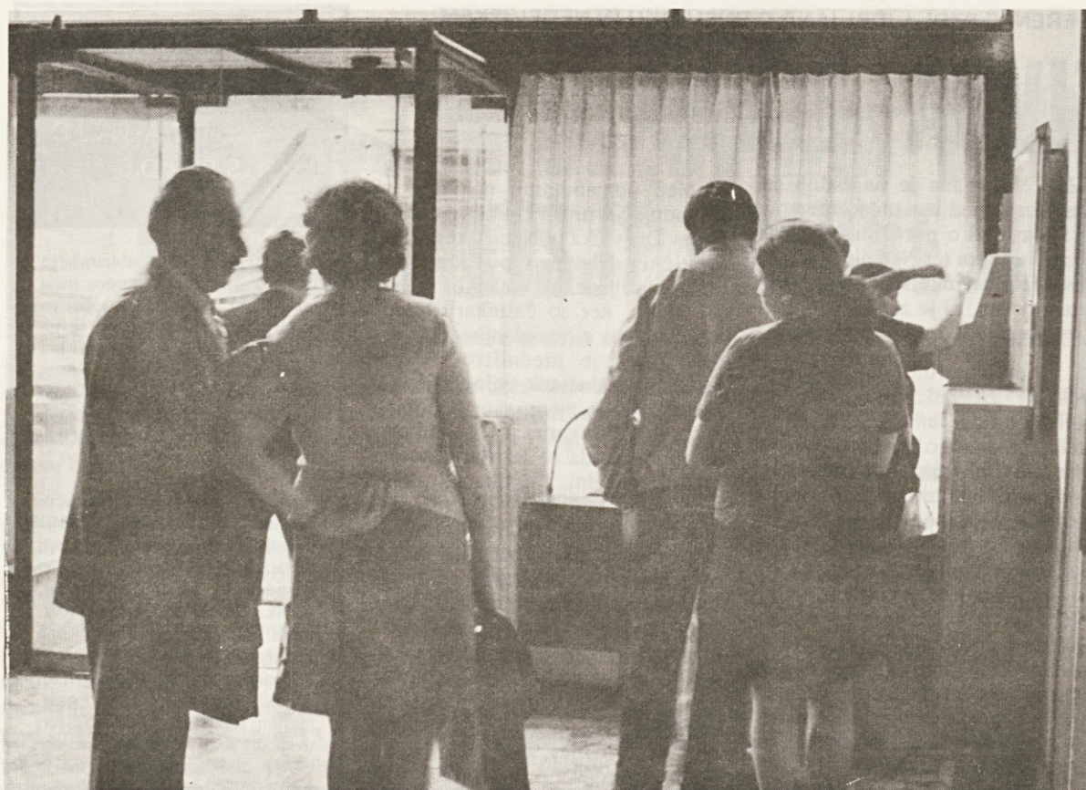
Doslej je lahko šel skozi našo avlo mimo vratarja vsakdo ali pa vsaj skoraj vsakdo. Bo poslej drugače?