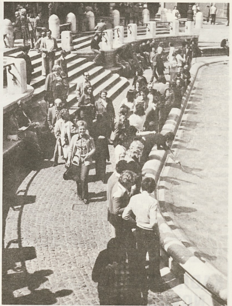
Z zanimanjem smo si ogledali vodnjak Trevi in po tradiciji metali čez glavo v vodo dinarje, ki so bili tačas v Italiji zelo cenjeni

Enako kot ljubitelji nočnega življenja so bili nekoliko razočarani tudi tisti, ki jim je bil glavni cilj nakupovanje v Rimu. Prvič, ker zaradi zgoščenega programa za individualne sprehode ni bilo dovolj časa, in drugič, ker v rimskih trgovinah (vsaj v četrti, kjer smo stanovali) ni bilo najti nič posebnega. Hitro je prevladalo mnenje,