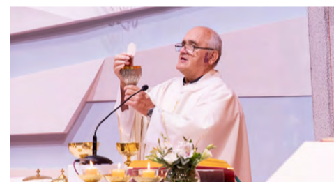
Slike Matjaž Godec