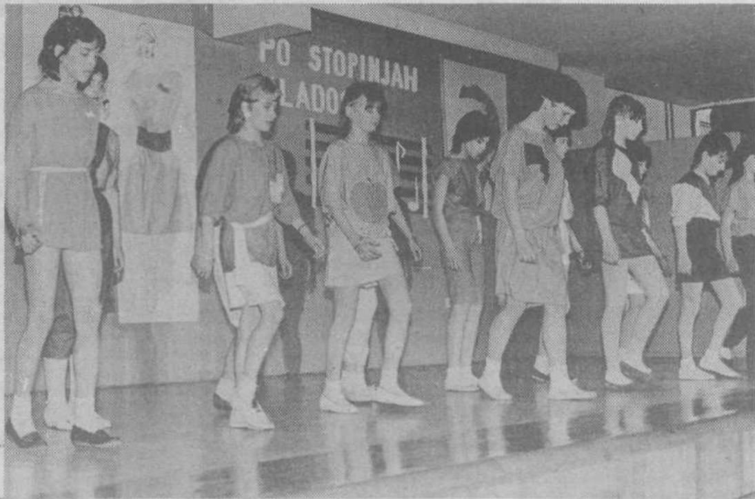
Prizor z male modne revije