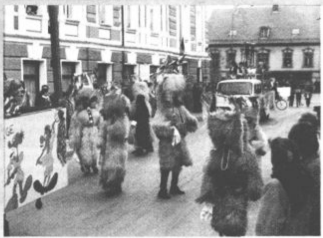
Takole je bilo na pustnem karnevalu v Šoštanju lani.