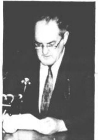
"Takoj na delo"

"Najprej lepa hvala za zaupanje. Res mi bo to temeljito spremenilo življenjski ritem, vendar sem resnično pripravljen sprejeti to veliko odgovornost. Želim in zahtevam tudi na naslednjih zasedanjih takšno udeležbo, saj moramo biti do bližnjih volitev zares ustvarjalni in hitri. Prva naloga je takojšnje imenovanje članov izvršnega sveta, druga sprejetje proračuna, ostale in zelo pomembne naloge pa so celotno področje komunalne dejavnosti in posebej razmere v Javnem podjetju Komunala, pomoč podjetjem in kmetijstvu, pri tem pričakujte moje obiske, saj mora naša skupščina povrniti izgubljeni ugled, zagotoviti moramo ustvarjalni dialog pri usklajevanju bistvenih nalog z vodstvi političnih strank, povem pa vam, da podtikanj ne bom trpel."