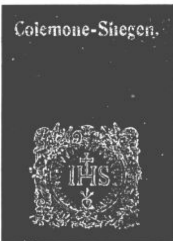
Sloviča čarovniška knjiga "Kolomonov žegen". Imetnikom so ljudje pripisovali izredne sposobnosti