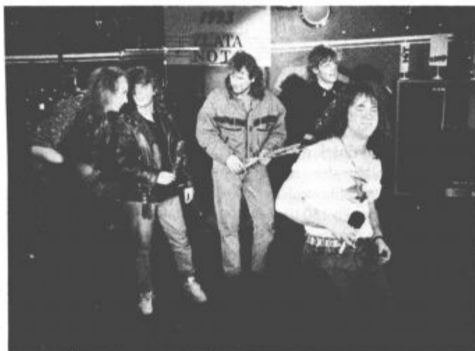
Zrete v kralje slovenske pop scene - Pop Design.

Sicer pa je podelitev nagrad potekala po vzoru podobnih prireditev, ki smo jih vajeni že s TV zaslonov.