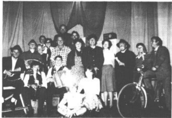
Izročilo s kakršnim se lahko ponaša malokdo in malokje