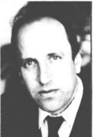
"Prepričan sem, da bomo uspeli"

(Novega predsednika Izvršnega sveta SO Mozirje ne seji iz povsem upravičenih razlogov ni bilo, pismeno pa je razložil razloge za sprejem kandidature).