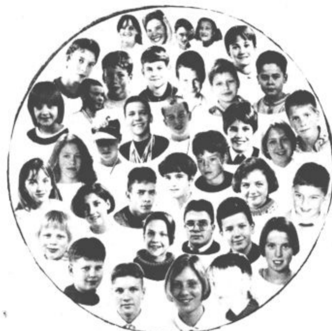
Mladi velenjski plavalci so se letos takole predstavili tudi na svojem koledarju

Vrhnjak, Rovšnik in Simič); mlajši dečki - 50 m hrbtno: 3.Danev 42,2, 6.Velički 44,2; 100 m delfin: 4.Korb 1:42,3; 200 m prosto: 5.Velički 3:01,7; Satafeta 4 x 50 m prsno: 2.Velenje 3:20,0 (Savič, Danev, Korb in Velički); deklice -100 m prosto: 1.Kološič 1:07,9, 3.Sladič 1:13,7, 4.Podpečan 1:14,9, 6.Jandrok 1:18,4; 200 m prsno: 5.Kukovič 3:20,0; 200 m delfin: 1.Kološič 2:50,0, 3.Pandža 3:19,0; štafeta 4 x 200 m prosto: 1.Velenje 10:36,7