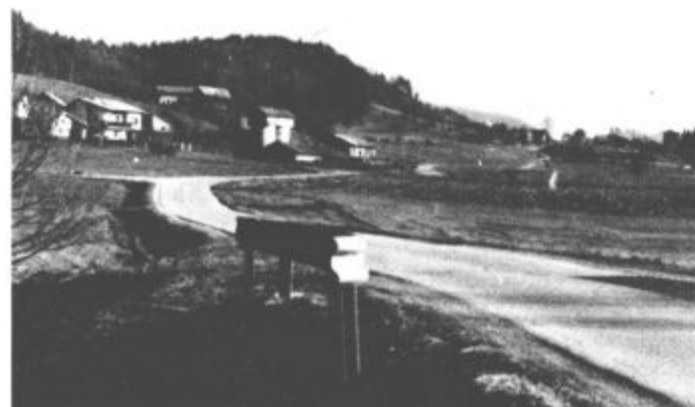
Podkraj pri Šentilju se začne pri mostu, ki ga vidite na sliki. Je na tromeji med Šentiljem, Ponikvo in Vinsko Goro.

sprijazniti s tem. Želijo si, da bi bili tudi uradno povezani s KS Šentilj in preko nje z občino Velenje. Tu se preprosto počutijo doma, njihove vsakdanje poti so prepletene s Šentiljem mnogo bolj kot s KS Ponikva, kamor sodijo sedaj. Dolgo so le v sosedskih pogovorih šepetali o tej svoji želji, sedaj postajajo glasni.