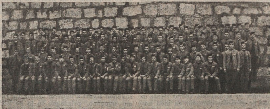
Dijaki - Orli pri sprejemu v Orlovsko zvezo 16. novembra 1919 v Ljubljani.

Z Bogom, prijatelji, in na svidenje pri t a k š n i zabavi!