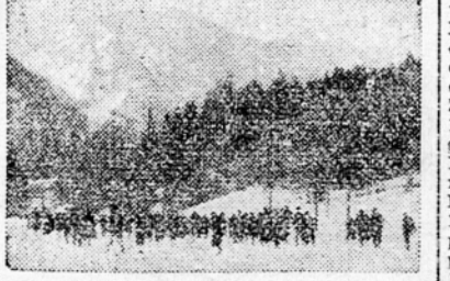
Ves dan je bila pot do skakalnice v Planici živa