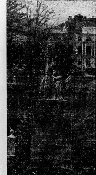
Akademija znanosti ZSSR

so razpravljali o državnem proračunu RSFSR za leto 1948 ter o izpremembah in dopolnitvah besedila ustave RSFSR. Finančni minister RSFSR Arsenij Sarvov je poročal o finančnem programu RSFSR za tretje leto povojne petletke.