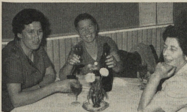
»Dvajsetletniki« na slavnostnem kosilu v menzi

Objava sklepov, takoj naslednji dan po seji, je treba pozdraviti ker, tako je bilo rečeno, bo s tem onemogočeno, namerno ali nenamerno, »tolmačenje«. V kali se bodo zatrlje tudi vse drugačne vesti od tistih, ki so resnične.