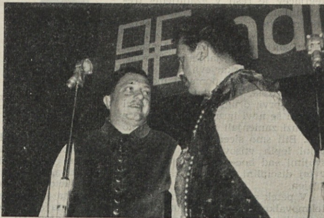
Žužu in Jeršinovec, člana Veselih planšarjev

Sodnik, ki je tri gole razveljavil, svoje naloge ni opravil najbolje. O nadaljevanju tekmovanja bomo poročali v prihodnji številki. Iz prvih štirih tekem imajo nogometaši Induplati 8 točk in količnik v golih 21:5.