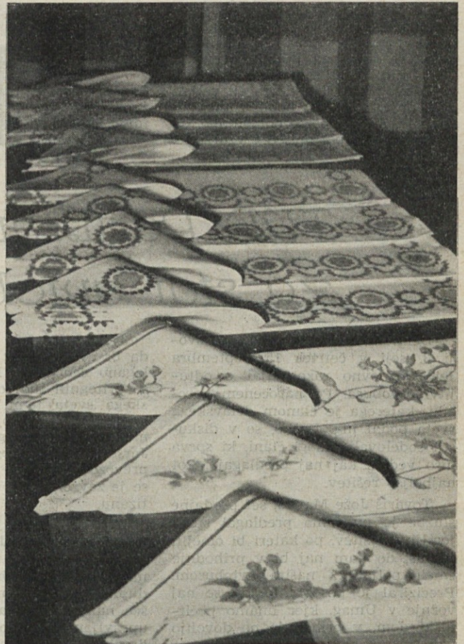
Induplati set garniture najlepše darilo za vsako priliko

Precej tkanin je tudi tiskanih. Vsi deseni pa so zanimivi in prikupni. Zaključno lahko ustvarjalcem novih izdelkov le čestitamo. Zadovoljni smo lahko obenem s programom dela, ker zagotavlja v zaključni fazi lažjo pot do kupca.