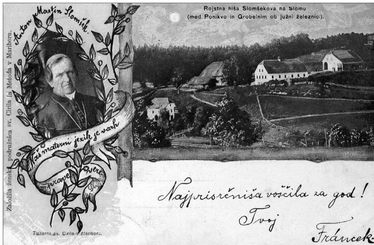
Razglednica Sloma, izdana ob stoletnici škofovega rojstva leta 1900.