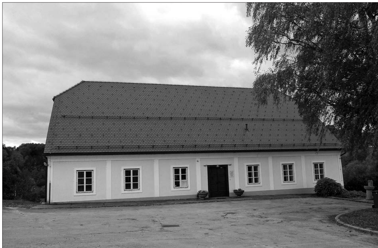
Slomškova rojstna hiša na Slomu (oktober 2021).