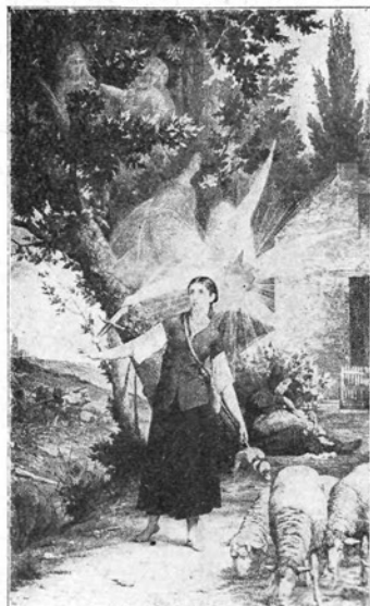
Ivanka sliši božji klic.

In še to! Vaša patrona je bila Francozinja. Nič ne de. V nebesih se ne dele po jeziki. Toda Veste zemljanke. Rajši bi imele domačinko za patrono? Prav imate, mi tudi. Naj Vas