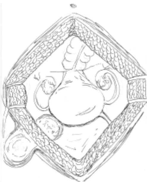
Sl. 3. Videz operativnega polja med operacijo.