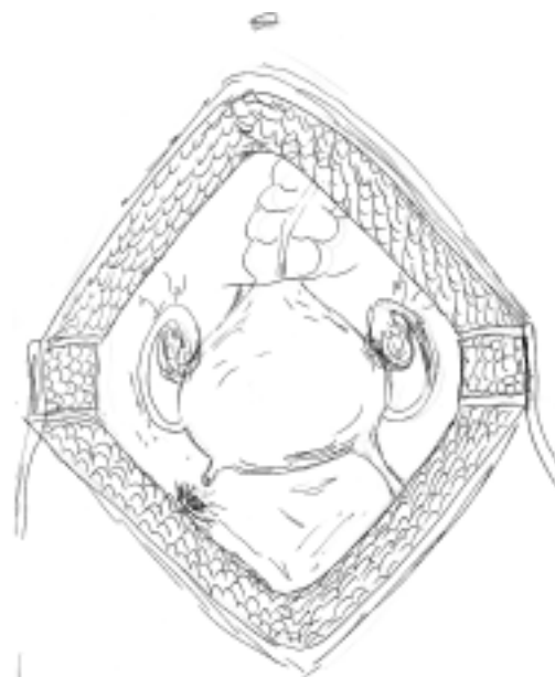
Sl. 4. Videz operativnega polja po odstranitvi tumorja.