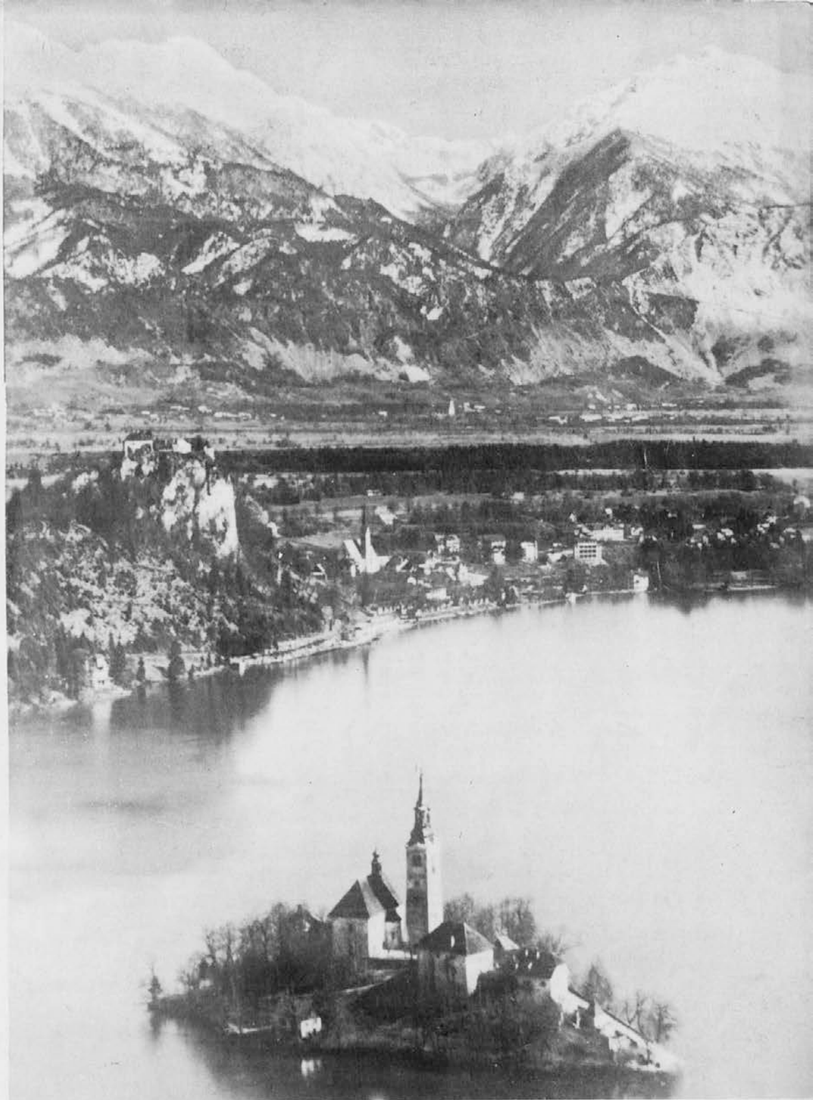
LAKE BLEĐ, SLOVENIA