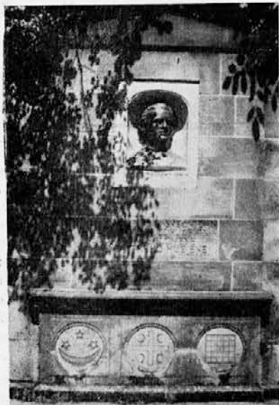
SIMON GREGORČIČ (1844—1906)

No poet has so endeared himself to the Slovene people as the priest Simon Gregorčič. His first volume of poems, published in 1882, was received with an enthusiasm and joy never equalled by any other volume of Slovene poetry. Gregorčič's poems are characterized by melody, tenderness and intensity. They speak from the heart to the heart. These poems were the source of the greatest consolation to an oppressed people; they cheered them in their sorrow, and prophesied brighter, happier days. Good examples of his love for his people are the poems "In the Night of Ash Wednesday" and "Our Star." There is also a strong ethical note in much of his poetry. Because of their smooth, melodious quality, Gregorčič's poems readily lend themselves to musical settings. Many of them have become virtually folk songs.