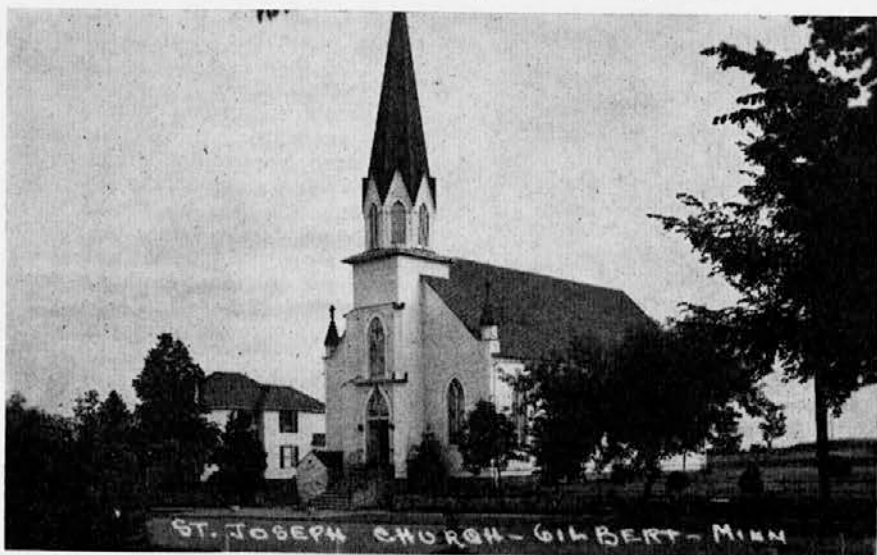
Cerkev Sv. Jožefa v Gilbertu, Minnesota.