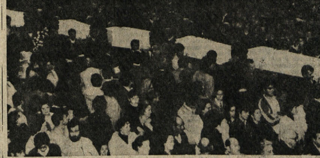
Včeraj je v španskem rudarskem mestu ogromna množica sledila ganjlivemu pogrebu mladih žrtev četrtkove strahovite eksplozije v osnovni šoli «Marcelino Ugaldes». Končni obračun nesreče je nekoliko manjši kot so prvotno napovedali. Umrlo je skupno 51 ljudi, od tega 48 otrok, v bolnišnici pa se zdravi še približno 30 uencev, medtem ko so večino zdravnikov že odslužili.