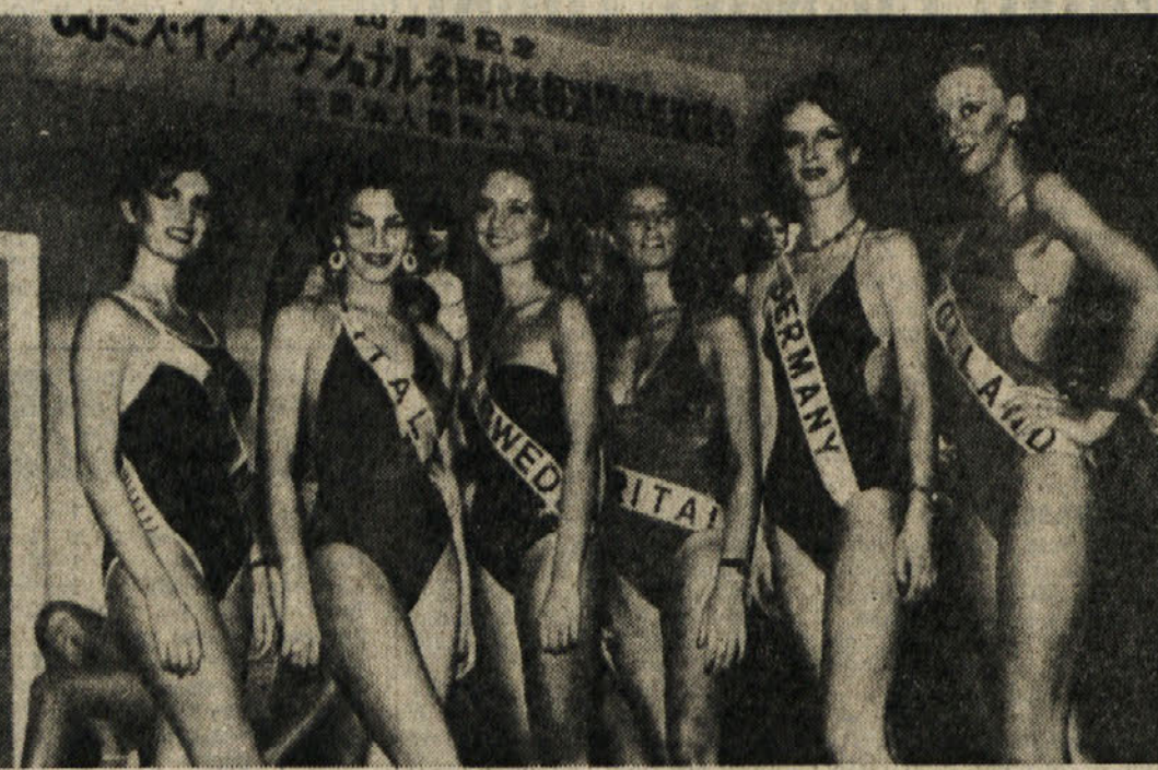
V Tokiu bodo 4. novembra izvolili lepotico sveta. Konkurentke (na sliki predstavnice evropskih držav) pa so že sedaj prispele v japonsko veleposelstvo.