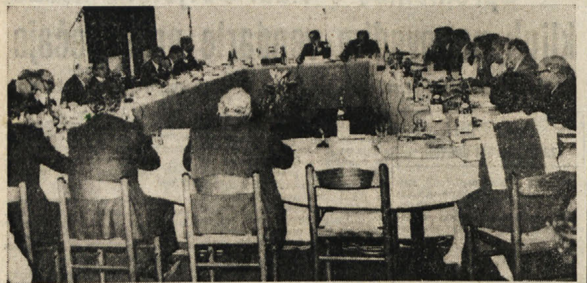
V hotelu «Europa» pod Nabrežino se je včeraj začelo VII. zasedanje iniciativnega odbora za sodelovanje med deželami v Alpskem loku. Zasedanje se bo danes nadaljevalo in zaključilo s povzki predstavnikov deželne odbora Furlanije - Julijske krajine.

Prizadevanja za vsestransko medsebojno zblizevanje prek državnih razmejitev - Konkreten prispevek Slovenije: vodnogospodarski zemljevid za celotno alpsko območje od Genovskega zaliva do Dunaja - Naslednje zasedanje jeseni 1981 v Sloveniji?