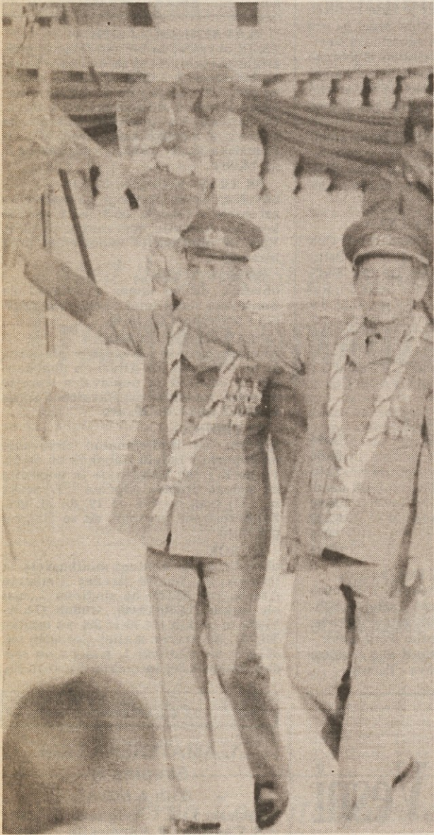
Vietnamska generala ne skrivata zadovoljstva, da bosta čez nekaj ur spet na domačih tleh

BANGKOK — Pred bivšo kraljevo palačo na glavnem phnompenškem trgu je večitisočglava množica prisostvovala slovesnosti ob umiku zadnjih vietnamskih vojakov iz Kambodže. Predsednik Heng Samrin se je zahvalil »vietnamskim prostovoljcem, da so rešili Kambodžo pred terorjem Pol Potovega režima«.