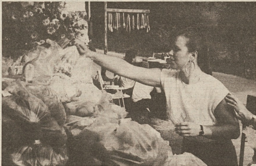
Bogati poljski pridelki v Gročani

Prav gotovo je tudi sončno vreme botrovalo lepemu uspehu letošnje druge razstave - sejma značilnih kmetijskih pridelkov Krasa, ki je v soboto in nedeljo bila v Gročani. Ugodno vreme pa ni bilo edini dejavnik za učinkovito postavitve tega kmetijskega praznika: v prvi vrsti gre namreč