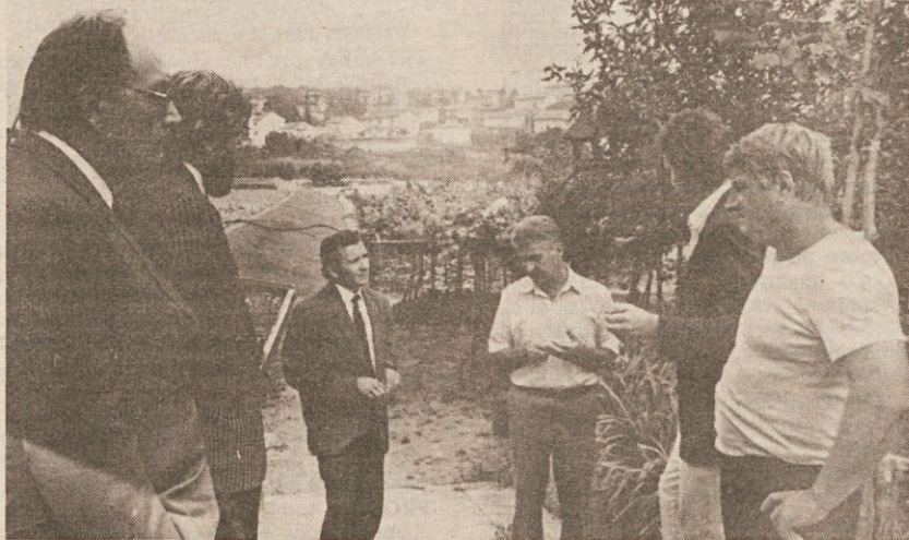
Med pogajanjem na vrtnariji Debelisovih

Lastniki zemljišč so skupno s Kmečko zvezo medtem vložili razne ugovore proti varianti regulacijskega načrta. Te ugovore je občinski odbor po nujnostnem postopku zavrnil, o njih pa se bo moral kmalu izreči še občinski svet. Nerazrešen je nadalje še drugostopenjski priziv, ki so ga vsi prizadeti vložili na Državni svet proti odloku o razlastitvi zemljišč.