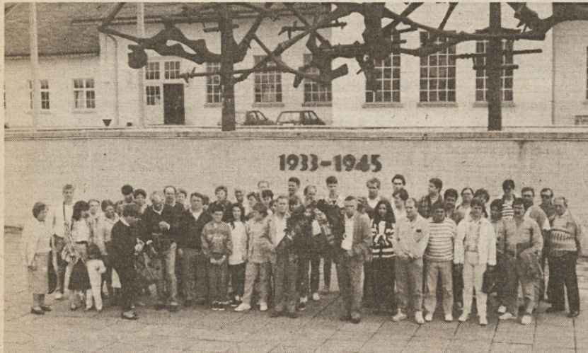
Prebenežani polagajo venec v Dachau

Čeprav nas od konca vojne ločujejo že obilna štiri desetletja, je NOB med našimi ljudmi vedno živa in to ne le med starejšo generacijo, ki je bila v našem boju aktivna, ampak tudi med mlajšimi generacijami, kar prihaja do izraza ob raznih prireditvah in pri delovanju raznih društev. Posebno velja to v slovenskih vaseh, kjer prebivalci negujejo grobove in spomenike padlim. In ni redko, da se prebivalci te ali one vasi podajo na obisk nacističnih taborišč ali grobov številnih naših ljudi, ki so tragično končali v nacističnih taboriščih. Tako so se odpravili na nekakšno »božjo pot« v taborišče Dachau Prebenežani, katerih kulturno društvo