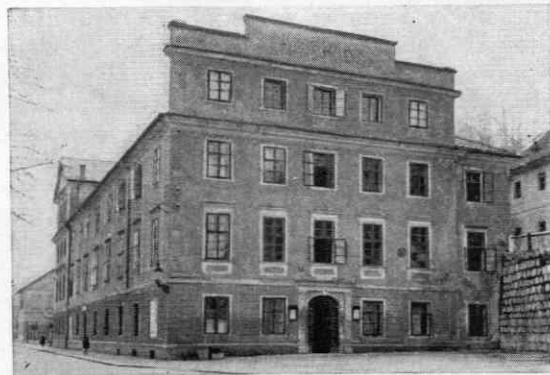
Ljudski dom — kjer je bilo leta 1870 mestno strelišče; 20. februarja 1870 se je v njem vršil ustanovni občni zbor »Delavskega izobraževalnega društva«

Dogodki v avstrijskem delavskem gibanju so živo odmevali tudi pri nas. Matica delavskega gibanja je tu postalo l. 1896 ustanovljeno »Delavsko izobraževalno društvo« v Ljubljani. Kakor vsa druga društva tako je tudi to postalo predmet policijskega nadzora in, ko se je pokazalo, da društvo brani delavske razredne interese, seveda tudi predmet policijskega pregona in raznih policijskih mahinacij. Tako je moralo tudi delavsko gibanje v Ljubljani uporabljati pri svojem delu poleg legalnih oblik dela ilegalne oblike, tajne sestanke in med drugim tudi širjenje ilegalnega tiska. Policijsko poročilo mestnega magistrata v Ljubljani iz l. 1873 omenja 2 , da so se že tega leta pojavili v Ljubljani letaki z naslovom »Demonstranten-Auszug«, ki so bil nalepljeni na samem magistratu in na obeh vogalih takratne Špitalske ulice v smeri proti Glavnemu trgu in sicer eden na rdečem, drugi pa na modrem papirju. Policijsko poročilo pravi, da vse kaže, »da so tukajšnji delavci v stiku z drugimi večjimi mesti in da so plakati prišli verjetno od drugod. Med delavci je večina dobrih, le vodja Kunc je tisti, ki s svojimi zvezami z delavskimi agitatorji v drugih