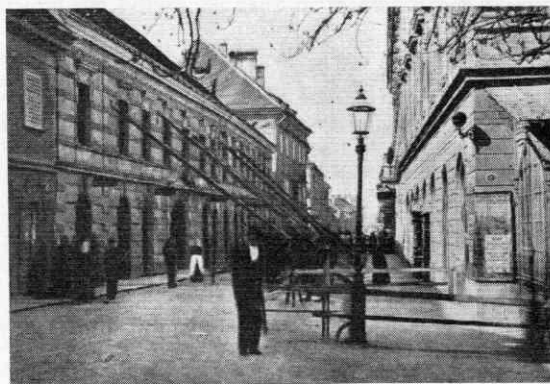
Šelenburgova ulica — sedež takratnega političnega življenja na Kranjskem; poleg »Citalnice« in »Kazine« sta v hiši št. 6 (poleg današnje pošte) in št. 1 (sedanja hiša Tičar) imela Železnikar in Tuma svoji delavnici v katerih so se zbirali delavci in v katerih je policija našla mnogo socialističnega in ilegalnega tiska