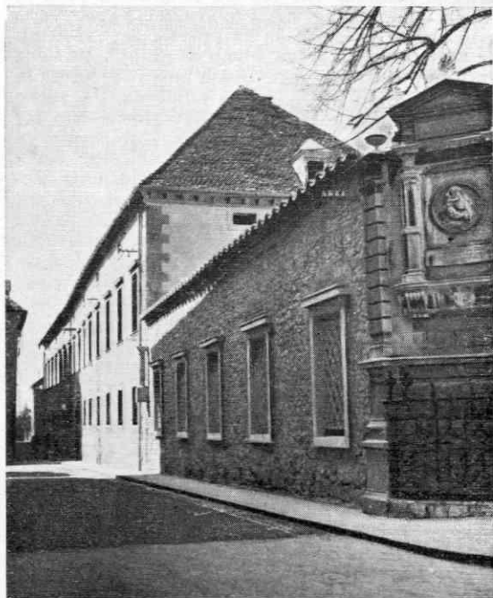
»Križanke« — v tem poslopju so se leta 1871 vršila vsa važnejša zborovanja »Delavskega izobraževalnega društva«