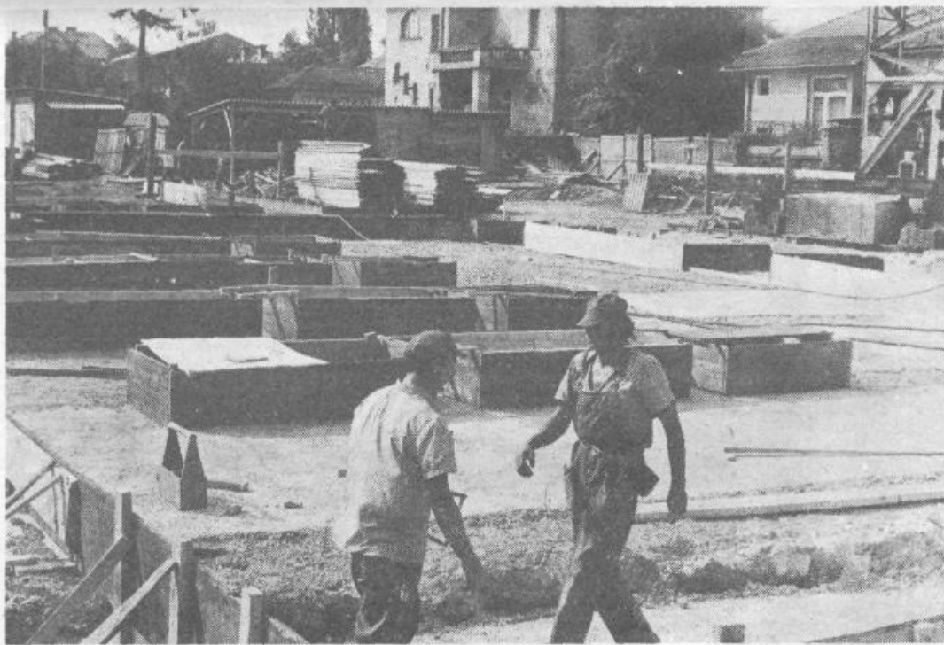
Gradnja doma za ostarele občane v Koleziji se je pričela

Zanimivo pa bi bilo ob tem slišati tudi to, kako se pobude družbenega pravobranilca samoupravljanja uveljavljajo v vrstih družbenopolitičnih skupnosti in v organizacijah združenega dela. Ob tem pa velja podčrtati tudi tisto usmeritev, ki še posebej podčrtuje vsestranskost razprav ob akcijah zaključnih računov. Vsekakor to poročilo, ki so ga delegati sprejeli, obvezuje vse samoupravne celice našega življenja, da še intenzivneje pristopijo k uresničevanju nalog.