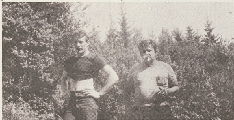
Kačje ride so premagane ...