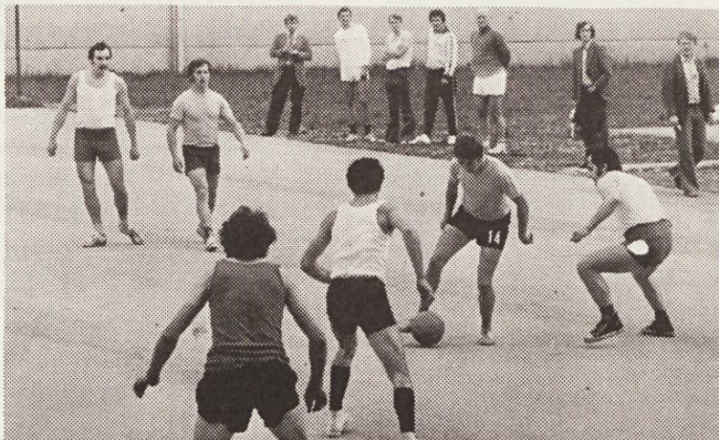
Nogometaši Dnevnika letos prvič nastopajo v malem nogometu v moščanski TRIM ligi. Na sliki prizor s tekme s Pletenino, ki so jo Dnevnikovci dobili s 6:1.

nasprotniki Dnevnika še Radio Študent, Oražmov dom, KTM Protektor, Elektroobnova, Zalog, Statistiki in Bizovik.