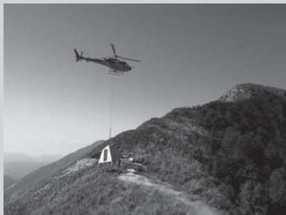
□ Slika 9. Način gradnje v Alpah danes: bivak na Muzcih na grebenu Stola nad Breginjem 1580 m.n.m. (vir 13).

betonska dela omejena samo še na temelje, objekt pa se na lokaciji samo montažno sestavi. Vodilni gradbeni material tudi danes ostaja les, saj se spodbuja uporaba trajnostnih gradiv.