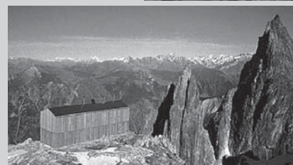
□ Slika 6. Planinska kočica Saleinaz v Švici 2691 m.n.m.; stene so bile predpripravljene v delavnici v dolini (vir 14).