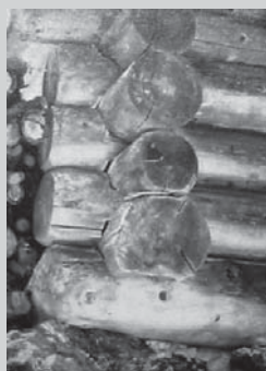
□ Slika 5. Detajl vogalne zveze: »Vorenčeve svisli« na Uskovnici (vir 9) ter primer kvadratnih ter okroglih brun v italijanskih alpskih regijah (vir 6).

Med klasična lesena tla spada ladijski pod, kjer so masivne deske položene na stik. Lesene pode delimo na trdodeščične ali mehkodeščične, odvisno od vrste lesa, ki ga uporabimo. V vsakem primeru je za zdrav bivalni prostor z leseno talno oblogo zelo pomembna obdelava površine lesa.