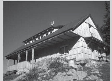
□ Slika 1. Orožnova kočica nekoč (vir 3) in danes