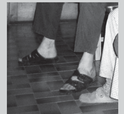
□ Slika 3. Tlak v Pogačnikovem domu na Kriških podih 2050 m.n.m.