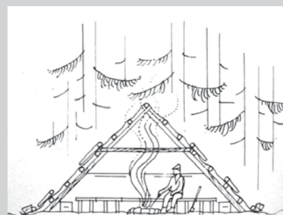
□ Slika 7. Skorjevka z ostrešjem na škarje, Menina planina (Cevc, 1984:96).