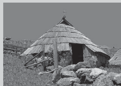
□ Slika 8. Preskarjeva bajta na Veliki planini