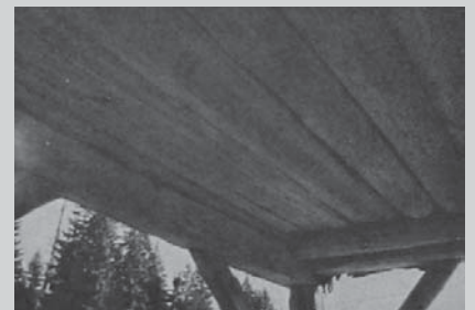
□ Slika 2. Podnice - Planina Vodični vrh (Cevc 1984:75)