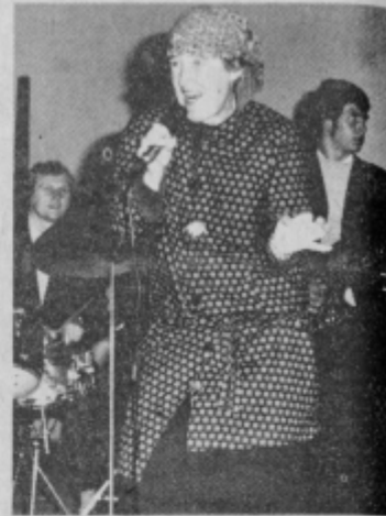
Nela Eržišnik – Marica Hrdalo v „ekstazi“ na središkem odru

Minulo soboto se je prebivalcem Središča ob Dravi in okolice nasmehnila edinstvena prilika v postavi znane humoristke, nepozabne znanke iz malih zaslonov Nele Eržišnik z „umetniškim“ imenom Marica Hrdalo. V turneji po Medžimurju je „skoknula med Središčance, da se malo pospomina“ kot je sama dejala. Kljub visoki vstopnini – 17 in 15 dinarjev – je bila dvorana TVD Partizan nabito polna. Originalnost te nedvomno ene najboljših humoristk našega časa je znova navdušila obiskovalce. Njeno izvirno „obiranje“ naših napak, lastnosti in posebnosti združeno značilno barvo kajkavskega dialekta je vzbujalo plazeve smeha. Najboljši „vic“ večera je bila pripoved o tatvinah. Med drugim se je nekemu človeku pripetilo, da so mu, medtem ko se je v cerkvi spovedoval, ukradli iz zadnjega hlačnega žepa partijsko izkaznico.