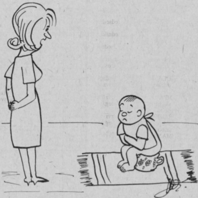
– Tak si, kot oče: seja brez konca, rezultata pa nikjer.