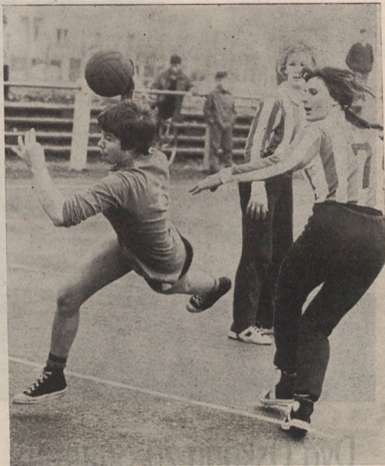
Kljub zmagi nad kranjsko Mladostjo je ženska ekipa Slovana zasedla šele drugo mesto