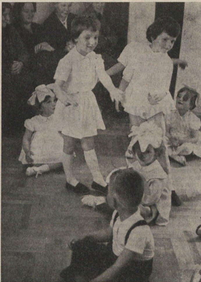
Pred nedavnim so v otroški varstveni ustanovi pripravili pristrčno prireditev. Prisotni starši in vzgojitelji so bili navdušeni ob spremeljanju programa, ki so ga izvajali naši najmlajši