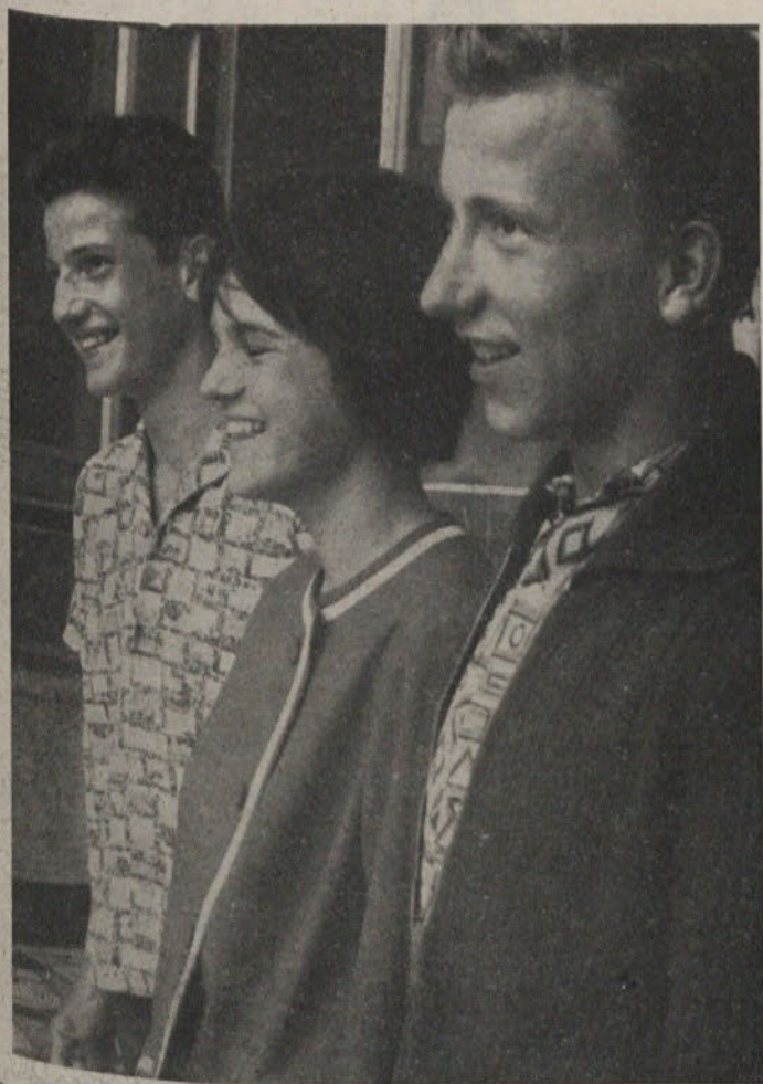
Sportno življenje na naših šolah postaja vedno živahnejše. Številna tekmovanja pospešujejo kvaliteto, pa tudi množičnost narašča. To je predvsem zasluga šolskih športnih društev, ki so na nekaterih šolah dobro zažvela. Na sliki vidimo najboljše atlete na šoli Ketteja in Murna

Slovanov rokomet zasluži vsekakor več pozornosti in pomoči, saj združuje veliko moščanske mladine, ki se vzgaja hkrati v dobre športnike in državljane.