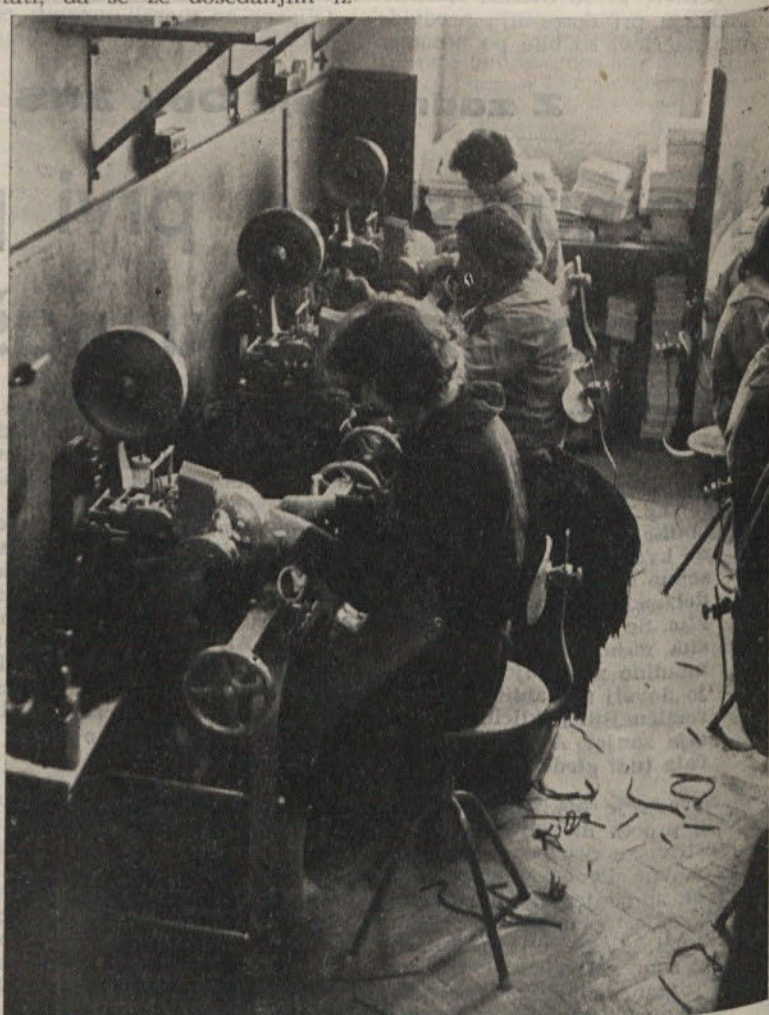
Tudi v Totri so v zadnjem času dosegli precejšnje proizvodne uspehe

predvsem izboljšana prehrana, boljša organizacija dela in nagrajevanje po litru namoženega mleka; obrat Dolsko je izpolnil načrt le 76 % — tu imajo letos mnogo bregih telic; tudi perutninarstva farma je izpolnila načrt le s 76,5 % — vzrok temu je pomanjkanje valilnih jajc, s katerimi se oskrbujejo iz lastne proizvodnje, pa tudi pomanjkanje nekaterih koncentratov, vitaminov in antibiotikov, na katere so vezani iz uvoza; tudi