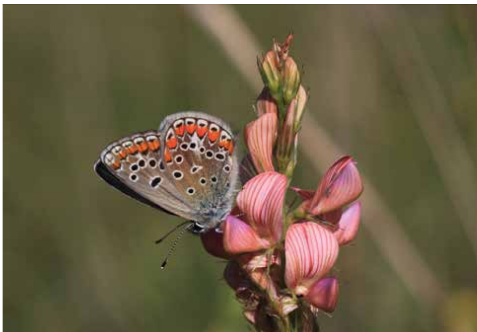
Deteljin modrin na turški detelji.

V letu 2014 z aktivnostmi nadaljujemo, tako da bomo spremljali stanje deteljinega modrina in turške detelje na obeh območjih, kjer smo v preteklem letu izboljšali habitat, in izvedli nove akcije izboljšanja habitata. V načrtu imamo tudi delavnice s kmeti s področja savskih prodov, na katerih jim bomo predstavili načine košnje, ki so prijazni do metuljev. Nadaljujemo tudi z ozaveščanjem prebivalcev Ljubljane glede naravovarstvenega pomena suhih travnikov ob reki Savi. Če se nam želite pridružiti tudi vi, nam pišite na info.metulji@gmail.com ali pa obiščite spletno stran projekta: https://sites.google.com/site/deteljinmodrin .