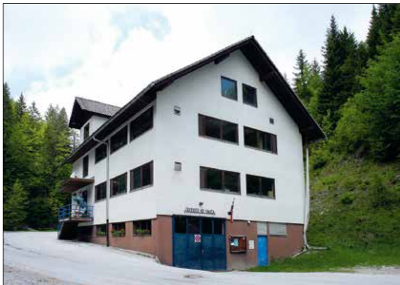
Večnamenski obrat v Davči 15. maja 2009.