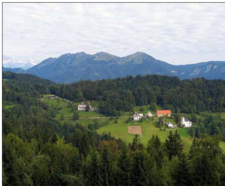
Davča, 2007. Farna cerkev Naše ljube Gospe presvetega Jezusovega srca, župnišče, Jemčeva domačija, levo šola, v ozadju od leve Triglav, Slatnik, Lajnar in Dravh. Foto: Anton Sedej, september 2007

Letos sva se po novem letu v ta namen večkrat srečala, običajno pri njem doma, in ob najinem kramljanju so nastajali zapisi, ki odstirajo njegova zanimiva in bogata ustvarjalna življenjska obdobja.