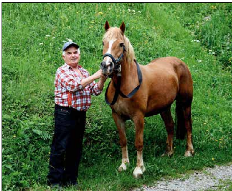
Vesetje do živali ga spremlja vse od otroških let; v Davči 19. maja 2009.

V povezavi s tem so bile tudi njegove zamisli o praznovanju prvega Terčeljevega dneva, katerega pobudnik je bil že v letu 2003. Še bolj uspešno pa so se njegovi načrti udejanjili letos, ko so na dan državnosti, 25. junija 2009, ter v sklopu občinskega praznika občine Železniki na davškem pokopališču ob