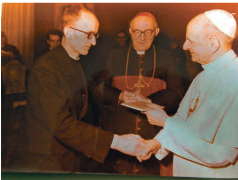
Člani Mednarodne teološke komisije na avdienci papežu sv. Pavlu VI. v Vatikanu 1976