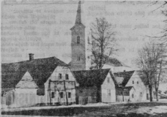
Za vse slovenske vasi so značilne mogočne stare cerkve, tako tudi v Cirkovcah.