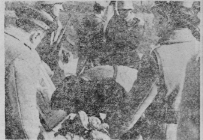
Se podpis in postal je zvesti »zakletje« branilec naše domovine.