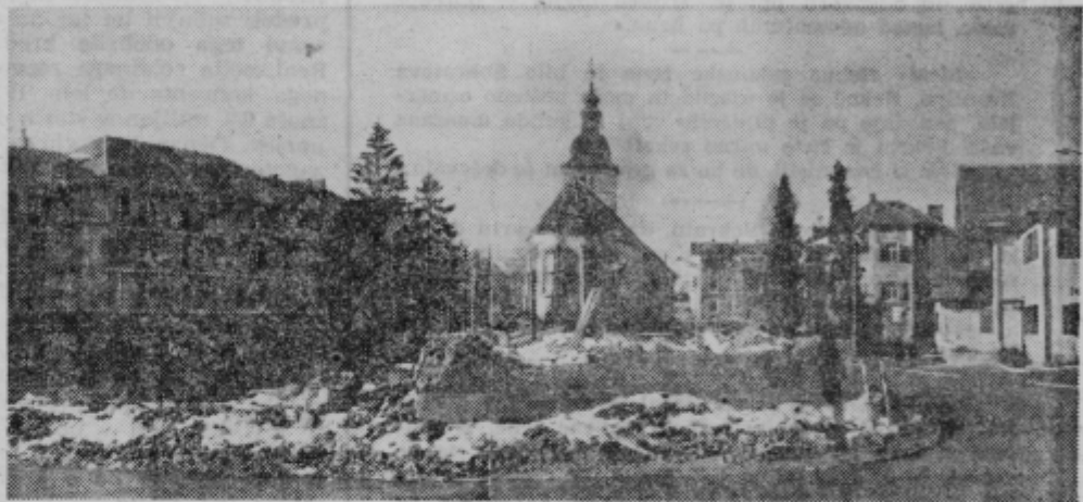
GP OGRAD Ormož gradi stanovanjsko poslovno zgradbo v Ormožu za trg (levo). Na ruševinah v ospredju slike bo nova avtobusna postaja. OGRAD je pred nekaj leti zgradil tudi ormoški hotel »Jeruzalem« (desno).

Takrat, ko so združili GP »Grad« in Opekarno so napravili dobro delo. Uspehi pa so žal vidni šele sedaj. Tu se združuje novo ustvarjena vrednost prvega in drugega obrata. Združeno podjetje je večje in močnejše ter kot tako lažje nastopa pri denarnih zavodih za dodelitev kreditov. Večje podjetje ima tudi več možnosti uveljavljanja v slovenskem gospodarstvu. Posamezna obrata v preteklosti