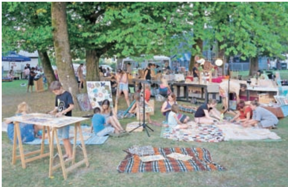
Kamniški festival z razgledom je tudi letos postal travniški festival z osrednjim prizoriščem v Keršmančevem parku.