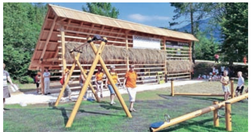
Kozolec v Kranjski Gori, kakršnega si za jutranjo telovadbo želijo tudi člani Šole zdravja iz Kamnika.

jim je rekreacija vsakdanji način življenja. Edinstvena vadbeno površina v občini Kranjska Gora je projekt Elanove družbe Inventa in je prvi takšen pri nas. Kranjskogorsko telovadnico pod kozolcem so uredili v dobrem mesecu dni. Kot kaže, bo takšen kozolec stal tudi v radovljiškem športnem parku. Dogovori pa so še z nekaterimi kraji na Gorenjskem. Kaj takega bi si želeli tudi v Kamniku, in sicer v Keršmančevem parku. Tu telovadimo člani Šole zdravja vsako jutro ob 7.30 v vsakem vremenu, a v bližini ni strehe, pod katero bi se lahko zatekli v primeru dežja.