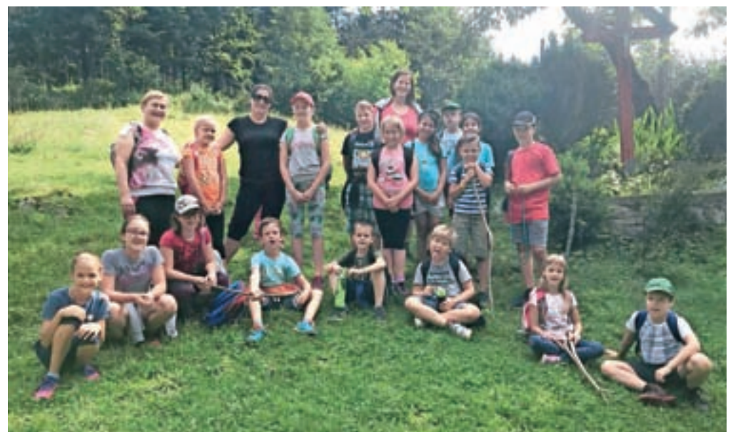
Letošnjega tabora se je udeležilo šestnajst otrok.

go leto spet srečali in se imeli nadvse imenitno. Letos je bilo povpraševanje za tabor večje od razpoložljivih mest, zato se vsem, ki niste uspeli s prijavo, opravičujemo in vas prosimo za razumevanje.