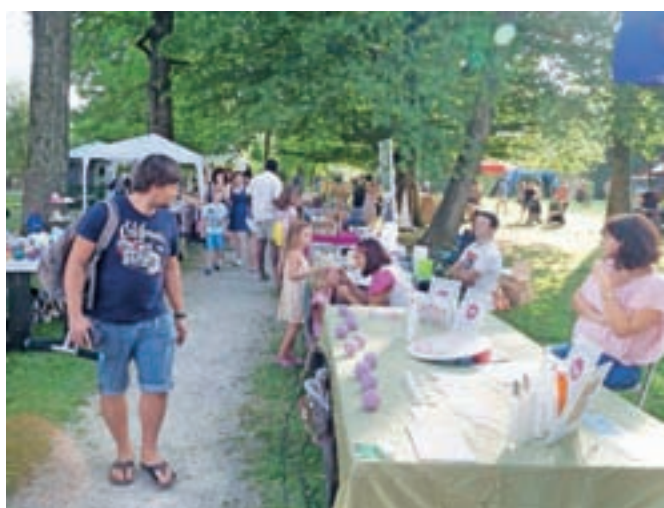
Keršmančev park je te dni poln najrazličnejšega dogajanja za vse generacije.

ki, temveč tudi medsebojno sproščeno druženje in uživanje v poletju. Duh Kamfesta oživlja mesto iz poletnega mrtvila, zato Goran Završnik zaključuje še eno uspešno festivalsko zgodbo takole: »Veselo v Kamnik in ... ostan' mo mal' kle!«