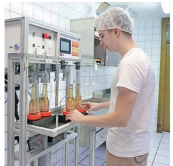
V prostorih v Volčjem Potoku lahko skuha in napolni po 2700 stekleničk na mesec.

Ob koncu našega pogovora je sledila še pakušina (pijača je res odlična) – in dobesečno: »Na zdravje!«