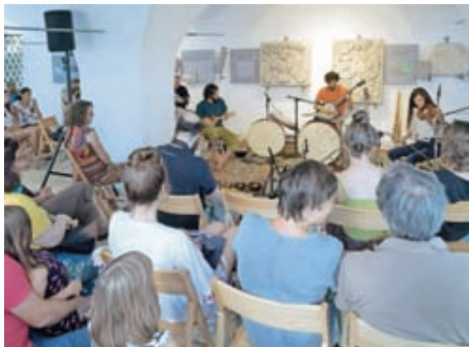
Eden od mobilnih odrov je gostoval tudi v lapidariju gradu Zaprice.