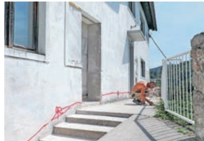
Kljub gradbenim delom v stavbi na Starem gradu delovanje gostinskega lokala ni moteno.

Pa bodo prenovljene prostore oddali najemniku, ki skrbi že za gostinski lokal? »Da, saj je že v razpisu za oddajo poslovnega prostora v najem zapisano, da bo najemnik ob obnovi pritličja prevzel tudi ta del,« pravijo na občini, kjer bodo v proračunu za prihodnje leto skušali zagotoviti tudi denar za opremo kuhinje.