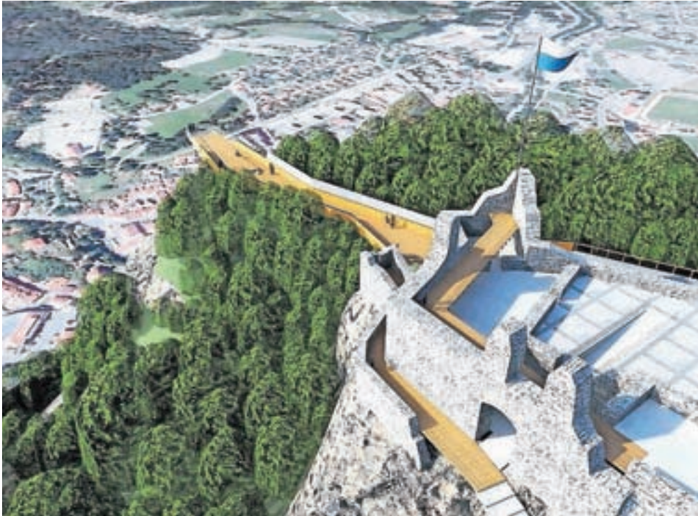
Takole bo videti razgledna ploščad na Starem gradu.