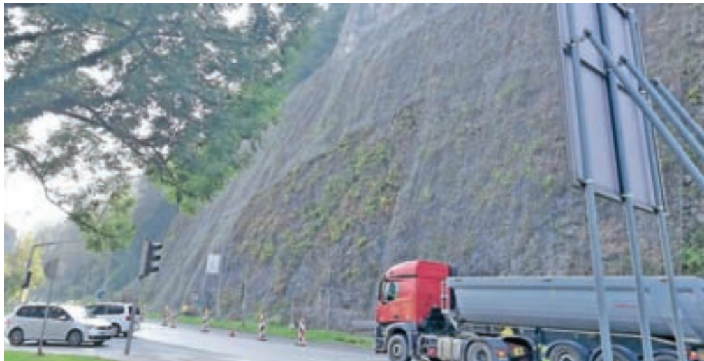
Zahtevne zaščitne ukrepe na pobočju Starega gradu ob kamniški obvoznici izvaja Gorenjska gradbena družba.

Prav tako je polovična zapora ceste zaradi zamenjave zgornjega ustroja vozišča državne ceste te dni vzpostavljena na cesti skozi Šmarco.