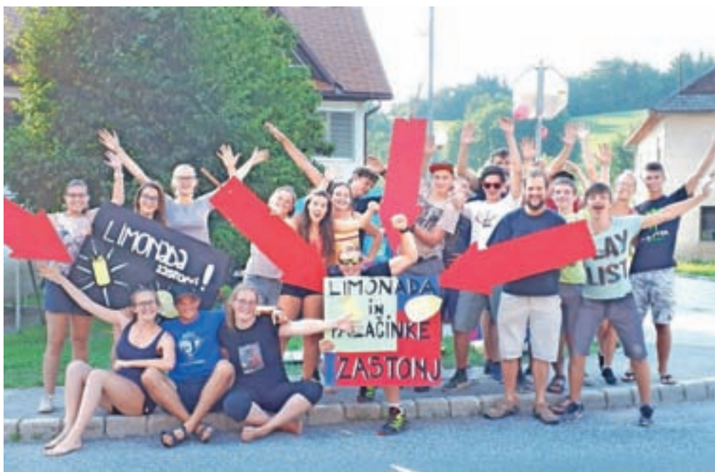
Na dobrodelni akciji so mladi tokrat delili limonado in palačinke.

S pripravljenimi plakati, osvežilno limonado in palačinkami so ob glavni cesti na parkirišče ob osnovni šoli vabili mimovozeče v soboto, 4., in četrtek, 9. avgusta. Obakrat so si (nevede) izbrali dva izmed najbolj vročih dni v letu ter obakrat ob cesti vztrajali po tri ure. Na prvi akciji so mimoidoči darovali 248,03 evra, na drugi pa 343,95 evra. Ustavilo se je ogromno dobrosrčnih ljudi, ki so se ob svojem dejanju lahko tudi okrepčali za nadaljevanje poti. Veliko pa je bilo tudi takih, ki so imeli glede na izraze na obrazu precej popetren dan in polepšano pot, saj so bili navdušeni