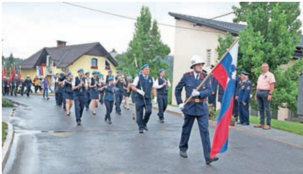
PGD Tunjice je praznovalo osemdesetletnico delovanja.