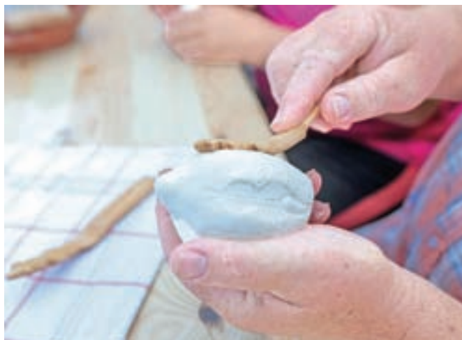
Nekoč so z lesenimi deščicami, imenovanimi pisave, okrasili svoj trnič in vsak pastir je imel svoj prepoznavni vzorec.

»Pastirji so trniče jeseni, ob koncu paše, kot dokaz ljubezni in zvestobe podarjali svojim izbrankam, ženam in dekletom,« pojasni Sonja in nadaljuje: »Trnič so vedno izdelovali v paru, po dve kepi sta bili okrašeni z enakimi ornamentami. Pastirji so enega obdržali, drugega pa podarili izvoljenkam, ki so sir hranile tudi več let. Če je obdarovanka sir sprejela, je bil to znak, da ji lahko dvori. Trnič ima obliko ženskih prsi, ker so pastirji med njegovim oblikovanjem mislili na svoje izvoljenke.«