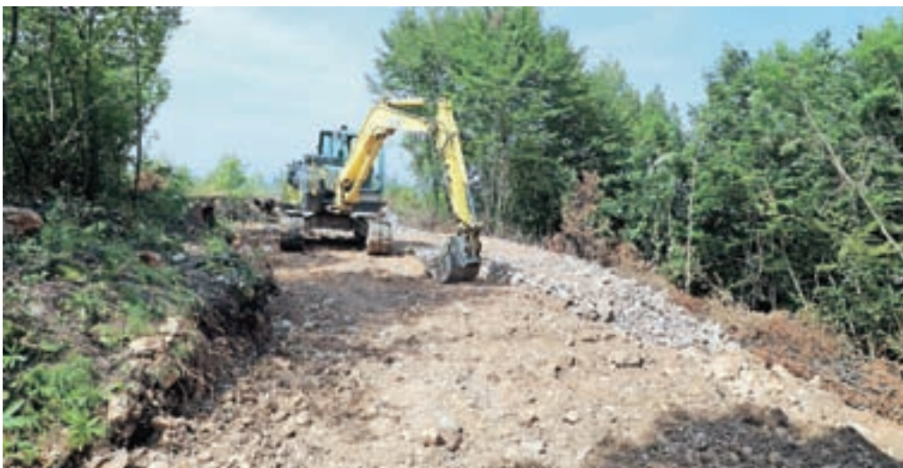
Pripravljala dela so že v teku.