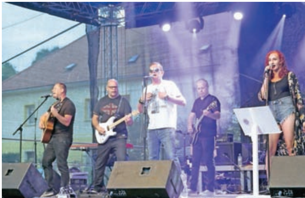
Festivalski presežek se je zgodil že uvodni dan s koncertom legendarne kamniške skupine Arche.