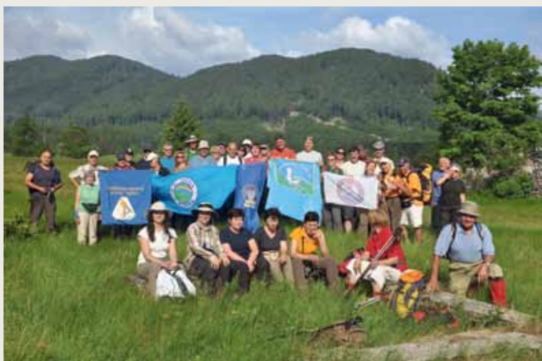
Zaključek srečanja na Gumancu

Film Sfinga ste si v juniju lahko ogledali še v številnih krajih po Sloveniji in tudi v Koloseju, film