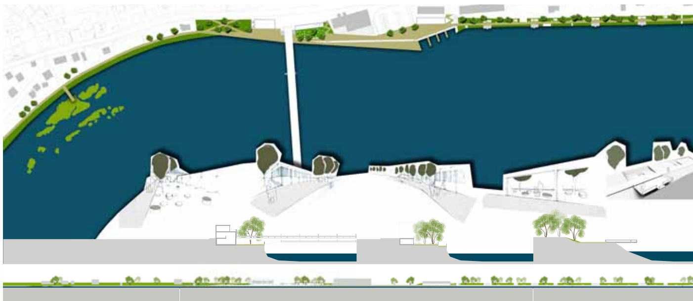
Slika 3: Predlog ureditve nabrežij ob reki Drini [Katarina Kušar, David Pignar, Nika Urbič, Tanja Završki].