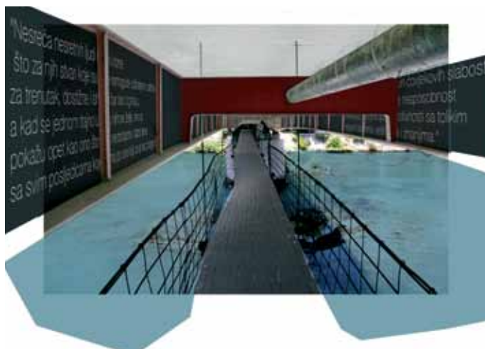
Slika 1: Predlog obnove mostu.

Pot spominov: V mestu Goražde je mnogo spomenikov, od katerih nekatere ne poznajo niti sami meščani. Z enotno karto, na kateri bi bili označeni vsi spomeniki, kjer bi bili kratki odpisi za turiste, ki bi se seznanili z osnovnimi podatki o spomeniku, bi z enostavno potezo rešili ogromno. Prav tako smo podali idejni predlog različnih poti (z različno skupno dolžino) po mestu Goražde. Kot primer za izvedbo je zagotovo skupinski pohod ob občinskem prazniku.