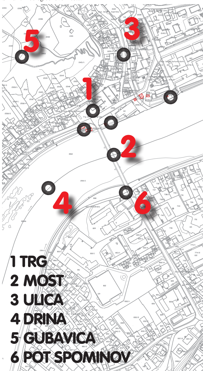
Slika 2: Mesto Goražde in lokacije tematskih nalog delavnice.