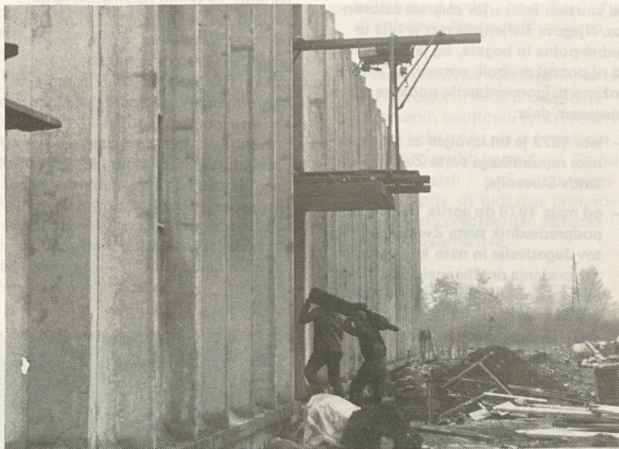
OB DELU RASTE ČLOVEK

Mnoga si leta učakal, kot bi se iz jekla rodil, bile jeklene borbe so tvoje, narod si v jeklo ti spremenil.