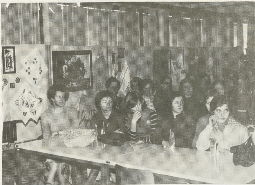
LE REDKOKDAJ SEDIJO TAKOLE