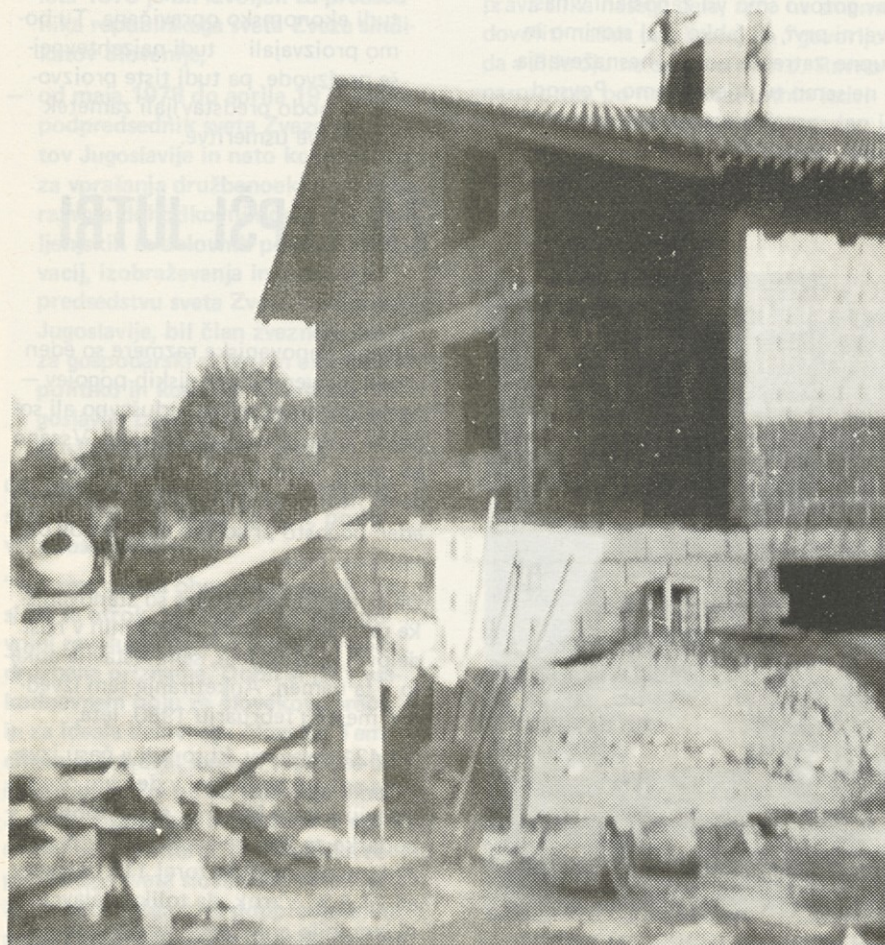
KOLIKO DELA, ODPOVEDOVANJA

Kar več kot polovica delavcev ima v bližini doma avtobusno postajo, vendar je tudi precej delavcev (13,4 %), ki so oddaljeni od avtobusne postaje več kot 2 km in morajo do tu priti peš oz. s kolesom.