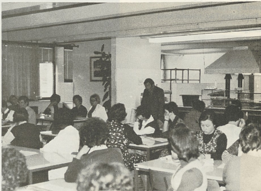
STABILIZACIJA, DOGOVORI, MISLI DELAVCEV