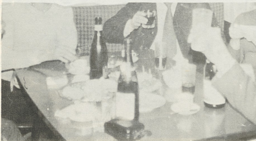
IN TAKŠEN JE ZAČETEK

Res je, da se vsi alkoholiki niso zmožni vrniti v urejen delovni in socialni status,