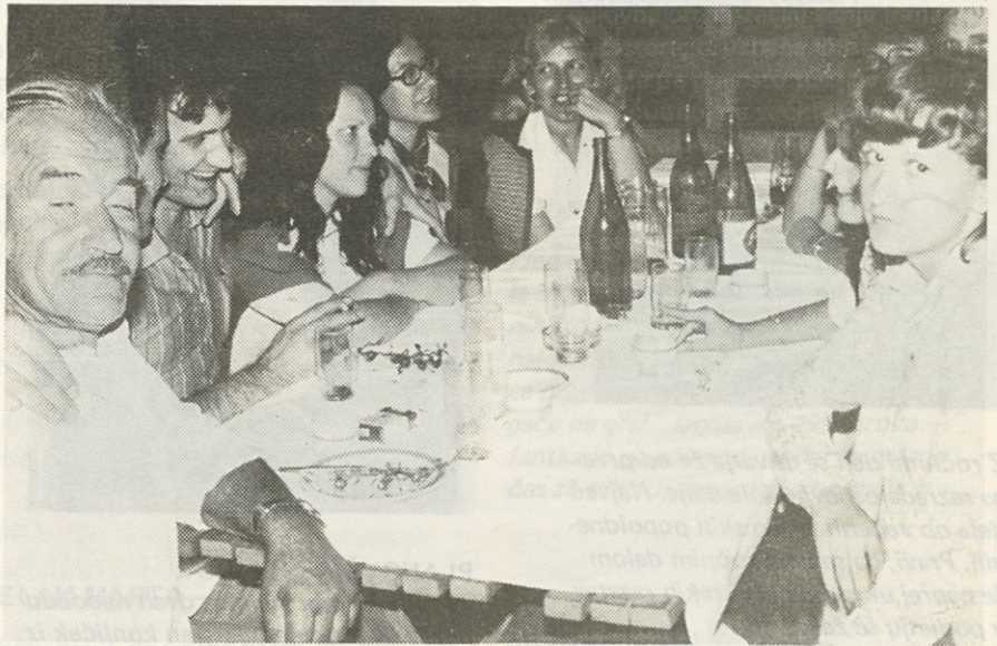
PO STEKLENICAH SODEČ, NE BODO ALKOHOLIKI

Zato ne bo odveč nanizati nekaj posledic, ki jih s sabo prinaša alkohol, za človeka.