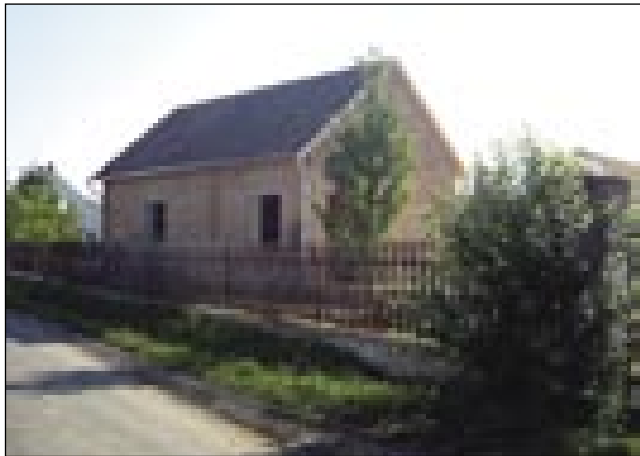
V tej zidini de graničarski muzej v Števanovcaj

zvedeti, zaka njim trbej. Nejuradno sam telko zvedo, ka oni nišo šolo v naravi (erdei iskola) škejo s te zidine vönaprajti. Dapa gda tau baude, tau ne vej, zato ka tam je