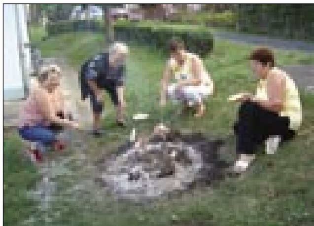
Koma se je nej vnauzalo, si je sam peko špejk