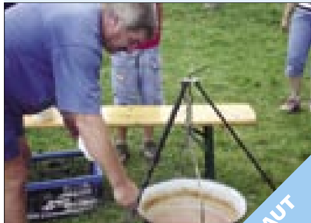
V kotlu se je kuhal golaž