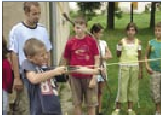
Lokostrelstvo je zanimalo fante