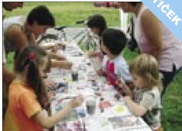
Otroci so risali in barvali, mamice pa pomagale