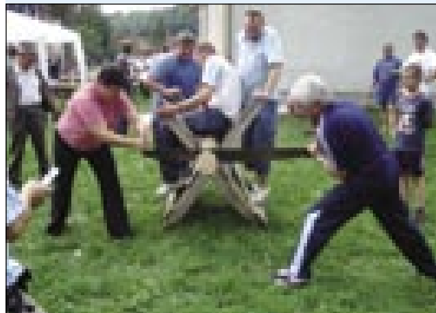
Tudi starši so tekmovali