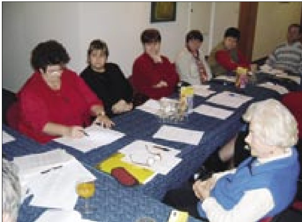
Člani predsedstva in kontrolne komisije

Korpič pa vse članke postavi na mesto, stere de tehnik v pondejlak že postavlo na računalniki pa na kreda napravi novine za tiskanje. Tau glavna urednica ške gnauk prejk mora vse prešteti, kejpe pogledniti pa té pošlejo v tiskarno v Mursko Soboto. Karči Holec ji v četrtek pripela iz tiskarne, gda en tau razdeli po porabski vasnicaj, drügi tau pa pakivajo na pošto na Vogrsko pa v tajinske rosage. Tau delo se od kedne do kedne etak vrti kak en mlin. Če steroga med nji nega v službi, svojo delo napravi naprej ali napravita dva drügiva delavca. Urednica tak vej, ka novine vsakšoj vesi pa v Varaši ranč tak pri cajti pridejo do lidaj, samo v Števanovci majo večkrat nišne nevole.