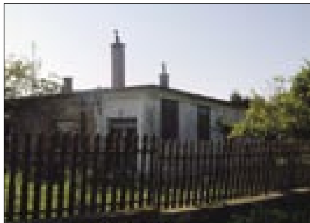
Narodni park je s svojo zidino ešče nika nej začno

»Gvüšno, ka de zanje tü zanimivo, ka leko notra staupijo v tisto zidino, štero so vsigdar samo od zvüna gledali, notra so pa nikdar nej smeli staupiti. Od 1. janura pa gda se granice odprejo, te bi se na Verici