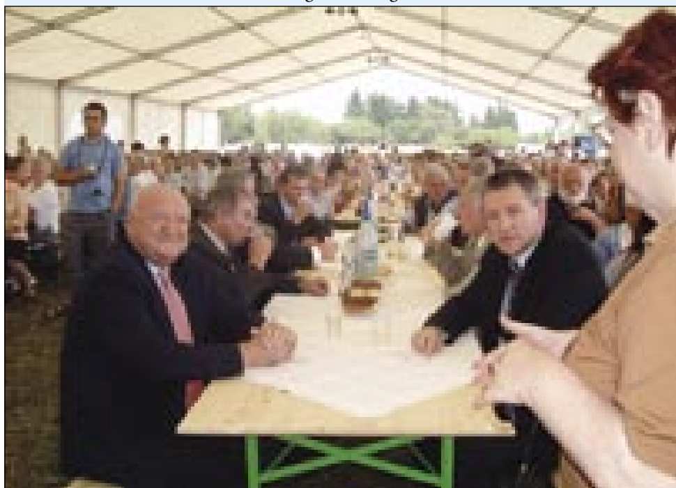
Telko lidi (eni pravijo, ka kaulek 800) ešče nigdar nej bilau na Državnom srečanju Porabski Slovencev