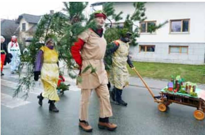
Izvirne »prevojske smreke«