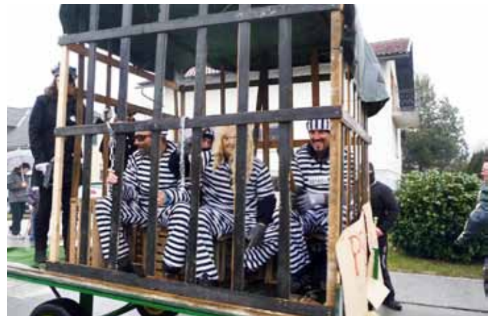
Arestanti so si prislužili prvo nagrado.