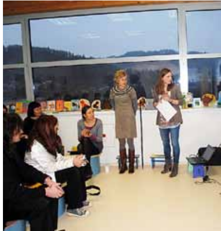
Na dogodku Kdo sem in kdo želim biti