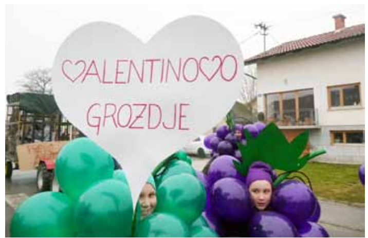
Izjemno domiselno – nagrajeno valentinovo grozdje

Najlepša hvala vsem, ki ste nam pomagali, da je naša pustna povorka s tekmovanjem za Naj pustni krof uspela. To so: Občina Lukovica in režijski obrat Lukovica, Godba Lukovica, PGD Prevoje, Gostilna Bevc, Pizerija in gostilna Furman, Gostilna Škarja, Gostilna Gašper, Piceri-