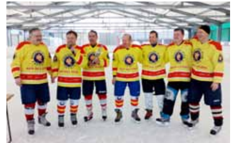
Zmagovalci prvega mednarodnega turnirja Veteranov Prevoje 2015 Prevoje 1

ljeval po večerji in bilo je veselo, saj smo tudi skupaj zapeli slovenske in srbske pesmi. V soboto, 21. februarja 2015, se je začel PRVI MEDNARODNI HOKEJSKI TURNIR VETANOV PREVOJE 2015 v Domžalah. Na turnir so se prijavile ekipe Prevoje 1, Prevoje 2, Vojvodina, Domžale in Ihan. Ker je ekipa Domžal zadnji hip odpovedala udeležbo, so sestavili še mešano moštvo Prevoje & GentelmaNS. Ker tri ekipe niso imele svojega vratarja, zato smo jih zagotovili iz HK Prevoje. Tako se je praznik hokeja začel s piskom sodnika Franca Andrejke med Prevojami 1 in Ihanom, ki se je po neodločenem rezultatu končala po streljanju penalov 2:3 za Ihan. Prevoje 2 : Novi Sad 1:2, Prevoje&GentelmaNS : Prevoje 1 0:1, Ihan : Novi Sad 0:1, Prevoje 2: Prevoje&GentelmaNS 2:0, Prevoje 1 : Novi Sad 3:2, Prevoje 2 : Ihan 2:1, Prevoje&GentelmaNS : Novi Sad 2:0. V nedeljo, 22. februarja 2015, Prevoje 1 : Prevoje 2, 1:0, Prevoje&GentelmaNS : Ihan 4:2. V tekmi za tretje mesto so Prevoje&GentelmaNS premagali Prevoje 2 z 2:1. V finalni tekmi so Prevoje 1 premagale Novi Sad s 4:1 in tako zmagale na prvem mednarodnem turnirju v hokeju na