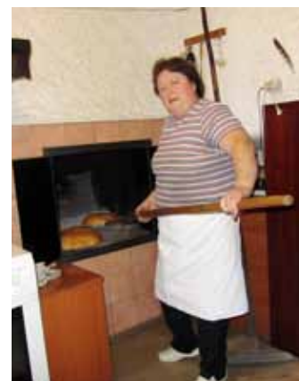
Silva peče oziroma jemlje kruh iz krušne peči