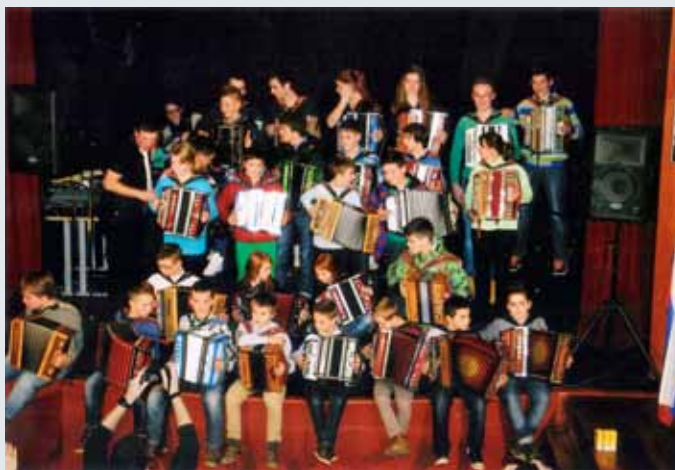
Po nastopu so zaigrali še skupaj.