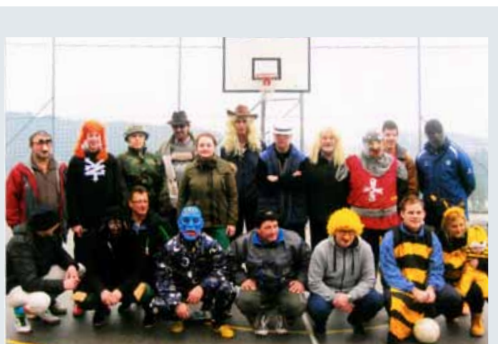
Dolgoletna tradicija se bo nadaljevala.