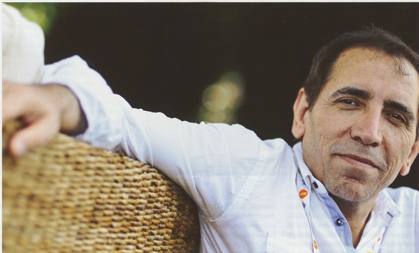
Mohsen Makhmalbaf na letošnjem festivalu v Motovunu

kinodvoranah, v Iranu pa je na žalost igral le v dveh majhnih dvoranah, ker ni bil po volji oblasti. Ta je menila, da film kritizira tudi iranske religiozne voditelje in sistem.