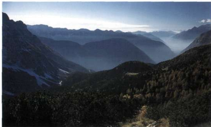
Planina v Plazeh

sal: »Človek je iskal in vedno išče srečo, stremljenje po sreči je izvor in razvoj življenja, stremljenje po sreči je človeku dalo vero, umetnost in vedo. Da se je dandanes veliko število ljudi, in smelo trdim, ne najslabših ljudi, z vso strastjo oprijelo alpinizma, je storilo to, ker človeka krepi, dviga in blaži. Bivanje pod milim nebom, v sončnem svitu, v svežem alpskem vzduhu, občevanje z zemljo, rastlinami in sopotovalci, svobodno, ljubo delo s fizičnim naporom, kar daje dober tek in mirno spanje, zdravje in nebojazan pred smrtjo, to je, kar donašata alpinizem in alpinistika bogato in obilo.«