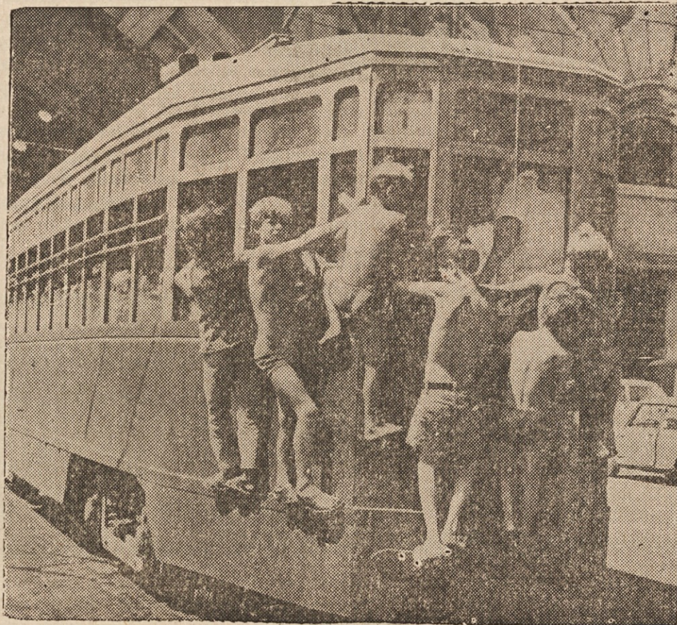
ZASTONJ VOŽNJA — Fantiči v Napoliju so se obesili na voz cestne železnice za zastonjkarsko vožnjo.