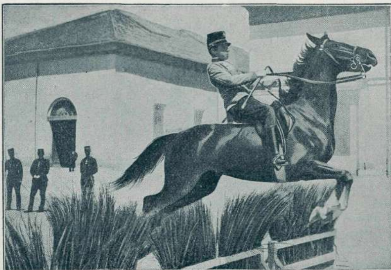
Španski kralj Alfonz XIII. v jahalnici.

Češka stenografija. Čehi imajo, kakor poroča „Sbornik těsnopisný“, devet stenografskih društev. Najstarejše in najštevilnejše je „První spolek stenografů Gabelsbergerských“ v Pragi. To društvo so Čehi osnovali l. 1859. Prošlega leta je imelo 147 družtenikov. Devetindvajseto leto že izdaja svoje glasilo „Těsnopisné Listy“. Poleg tega je izdalo učno knjigo „Těsnopis Český“ s stenografsko čitanko. Podobno društvo v Brnu izdaje „Těsnopisný Věstník“.