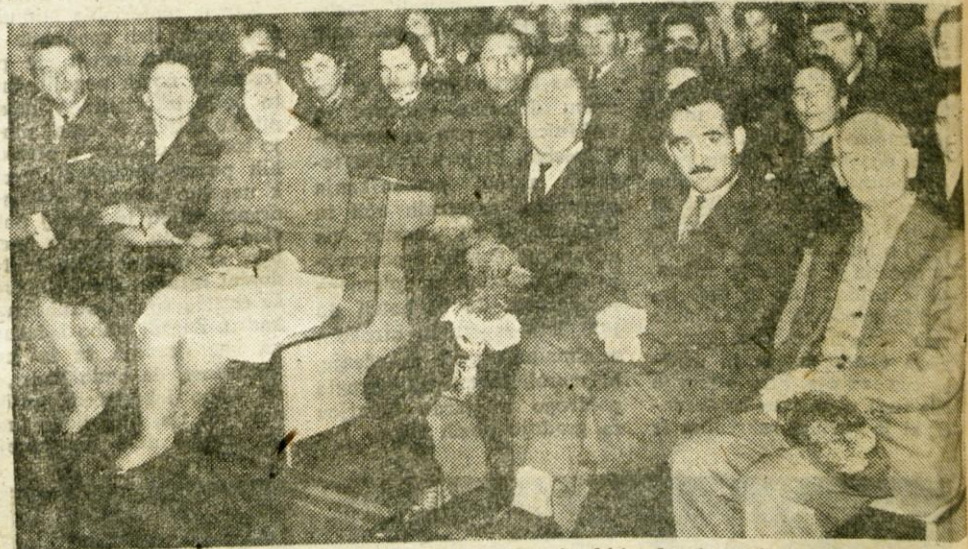
Udeleženci krvodajalske svečanosti, v ospredju so sovjetski in drugi gostje.

šim krvodajalcem in jim podelil značke, ki jih podeljujejo najboljšim krvodajalcem Sovjetske zveze. Sovjetski gostje so skupaj z drugimi udeleženci prireditve z velikim navdušenjem pozdravili nastop moškega pevskega zbora Svobode iz Stražišča in ansambla Veseli planšarji.