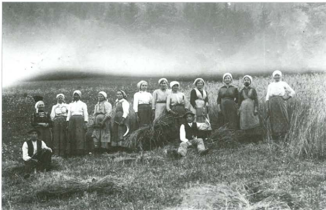
Žanjice v Starem trgu po prvi svetovni vojni (1920)

dozorevajočo ajdo in občutno zmanjša pridelek. Ajda zanesljivo uspeva na izbranih jugozahodnih legah. Na obrobju naših dolin so v času spomladanskih in jesenskih slan temperature za 2 do 3° C višje kot na dnu dolin. Megla, ki tod prekriva zemljo, jo štiti pred močnejšo ohladitvijo. Po dolgoletnih izkušnjah bo slana zagotovo »posmodila« ajdo, če jo obsije jutranje sonce (vzhodne lege).