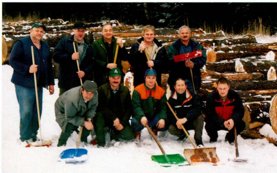
Nič nas ni presenetilo, tudi snežne padavine ne. Bili smo pripravljeni.