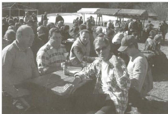
Na koncu počitek in zaslužen pivo