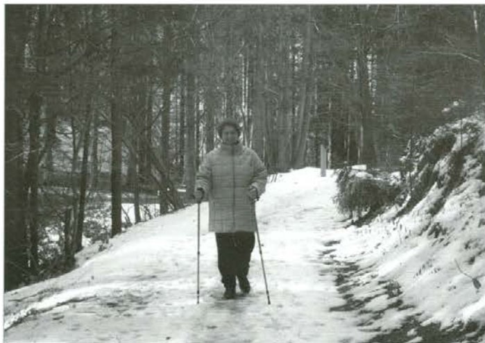
Gozdno učno pot Pistrov grad obiskujejo tudi pozimi

Pot gre mimo kulturno-zgodovinskih spomenikov, zato so njeni obiskovalci tudi izletniki od drugod. Ob poti so stebrički z informativnimi tablicami o gozdu in so v pomoč za lažje spoznavanje le-tega, razmišljanje o njem in njegovih vrednotah. Smerokazi, ograja in klopi na poti sprehajalcu omogočajo