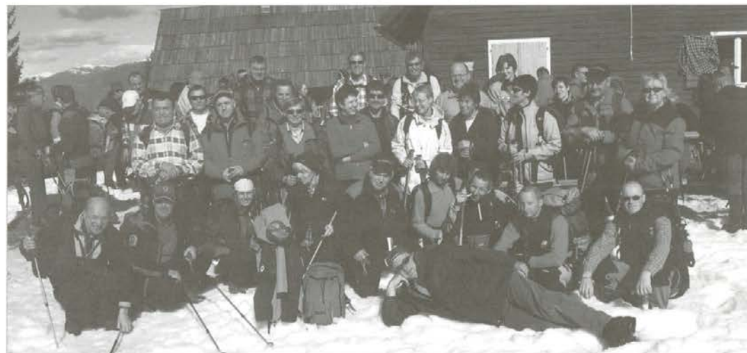
Skupinska fotografija udeležencev pri koči nad Arihovo pečjo

spominsko diplomo in značko, našega prihoda pa so bili še najbolj veseli domačini – koroški Slovenci, ki na tak način čutijo, da niso osamljeni v borbi za ohranitev slovenskega jezika na Koroškem.