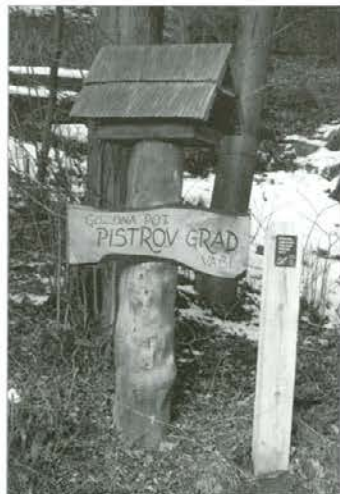
Na gozdni učni poti v Vuzenici

Pred osmimi leti smo gozdarji s sodelovanjem z občino Vuzenica uredili in opremili gozdno pot Pistrov grad, ki poteka po obronkih gozdov v neposredni bližini Vuzenice. Pot je dobila ime po ostankih ruševin nekdanjega gradu, kjer je živel in ustvarjal slikar Oskar