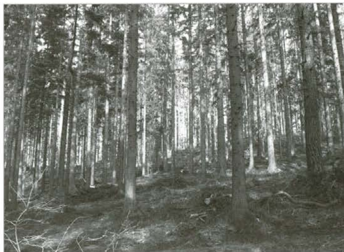
Urejeno sečišče po končani strojni sečnji

Lastnica državnih gozdov je država Republika Slovenija, katero uradno zastopa Sklad kmetijskih zemljišč in gozdov Slovenije, s koncesijo pridobljena dela pa v njih po navodilih Zavoda za gozdove Slovenije izvajajo delavci gozdnih gospodarstev. Tako kot za zasebne gozdove gozdarji javne gozdarske službe izdelujejo dolgoročne in letne načrte gospodarjenja in vlaganj tudi za državne gozdove. Za boljšo in kvalitetno izvedbo z letnim načrtom načrtovanih del je potrebno predhodno medsebojno usklajevanje vseh, ki aktivno gospodarijo v gozdu. Tako smo se 14. februarja v prostorih koroške javne gozdarske službe na usklajevalnem sestanku sestali predstavniki ZGS OE Slovenj Gradec, Sklada kmetijskih zemljišč in gozdov Slovenije, GG Slovenj Gradec in Koroške gozdarske zadruga, da smo uskladili načrtovana dela v »skladovih« gozdovih v letu 2007.