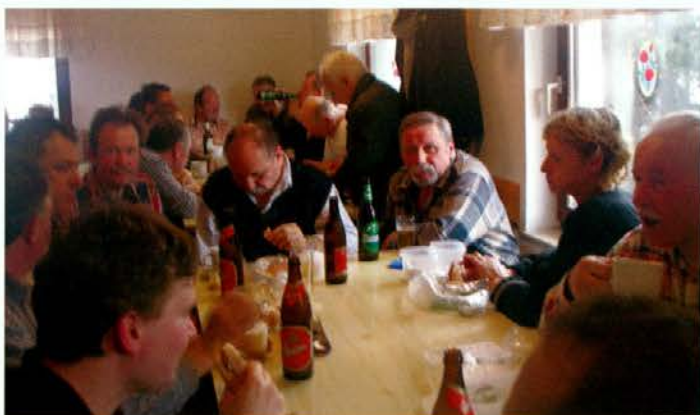
V koči je bilo kljub izmučenim nogam veselo in prijetno.