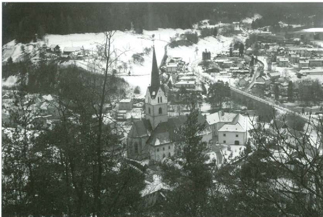
Iz Gozdne učne poti Pistrov grad je lep razgled na Vuzenico

Lepa jesen je omogočila, da smo stebričke v celoti zamenjali in obnovili z macesnovim lesom ter izdelali nove napis-