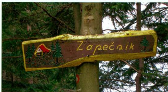
Tudi takole lepo oblikovane smerne table smo videli na poti.

vili gostinsko sobo, kuhinjo in nad pritličjem namestili novo betonsko ploščo. V letošnjem letu jih čaka še obnova prostorov, ki so namenjeni prenočevanju gostov, saj računajo, da bodo do poletne sezone že