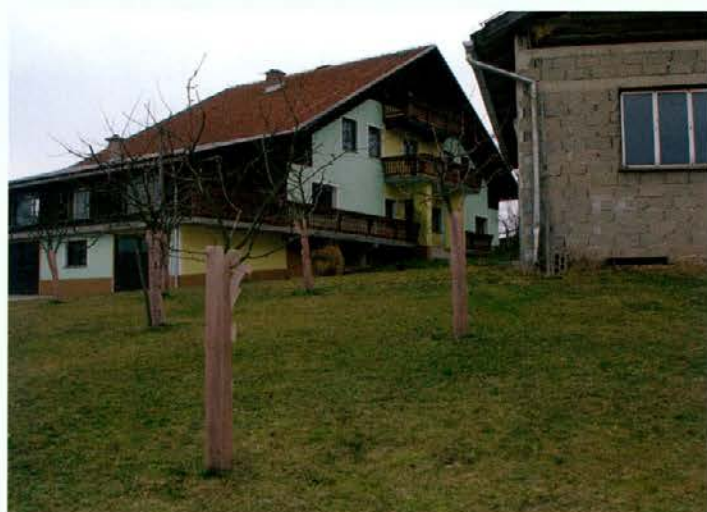
Na Šisernikovi domačiji se pohodniki običajno ustavijo in okrepčajo.