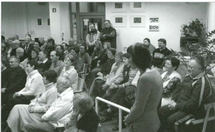
Številni domačini so napolnili prostor knjižnice.