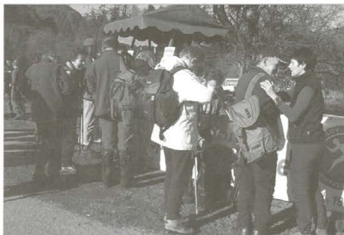
Registracija udeležencev na začetku poti