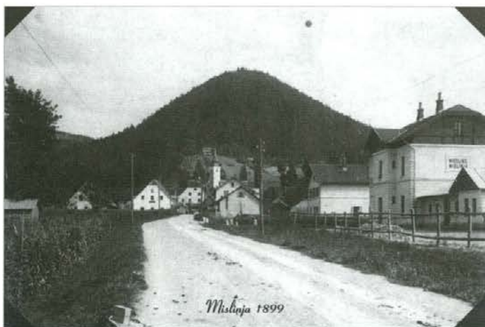
Takšna je bila Mislinja v začetku 20. stoletja.