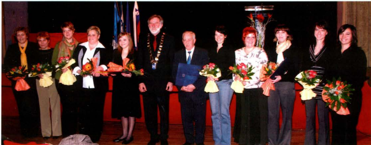
Dobitniki Bernekerjevih plaket in nagrade za leto 2007

Po končani podelitvi so si obiskovalci lahko ogledali monodramo Pavlek.