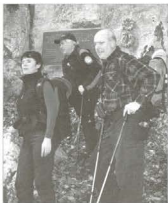
Pod Arihovo pečjo je spominska plošča.