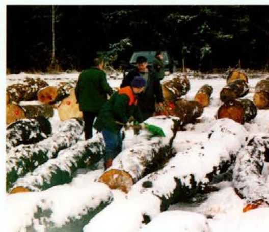
Trikrat očistiti sneg z 618 kubičnih metrov hloedovine ni mačji kašelj