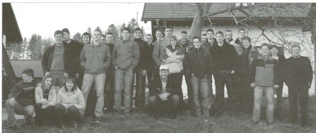
Fotografijo smo posneli na kmetiji Frešer

o kakovosti mleka in sira, nas je seveda zanimala še kakovost vina. No, tudi o tem kmalu ni bilo več dvoma, o čemer je pričala vesela domača pesem, ki se je že v večernih urah razlegala iz vinskega hrama. Dan pa med toplino in domačnostjo vse prekmalu mine, kar pa ne velja za spomine, ki bodo ostali kot živ dokaz močne volje, vztrajnosti in pridnega dela, ne ozirajoč se na čas in prigode slovenskega kmetijstva.