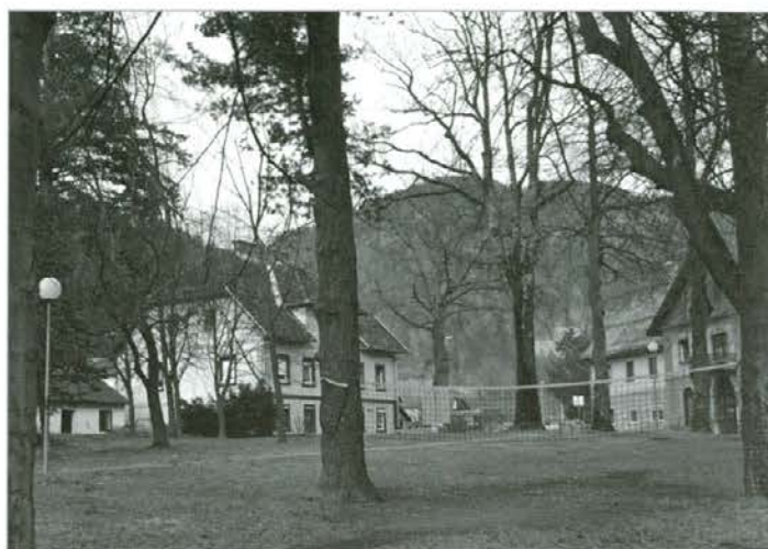
Lepo ohranjen prostor, kjer je bila nekoč Pergerjeva graščina.