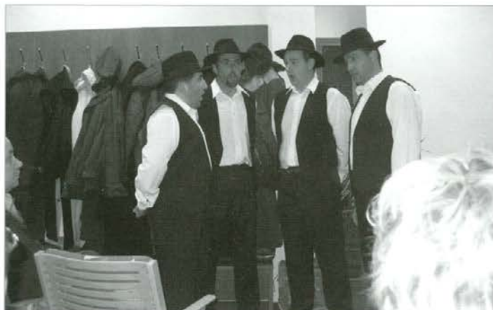
Fantje z vasi so otvoritev popestrili s starimi pesmimi.

nik, ki že leta skrbno zbira arhivski material po celotni Mislinjski dolini, se s posebno ljubeznijo posveča tudi gornjemu delu Mislinjske doline, ki jo sedaj zajema občina Mislinja. Tu je namreč preživel svojo mladost kot učitelj na osnovni šoli in ga na ta kraj vežejo še posebej lepi spomini.