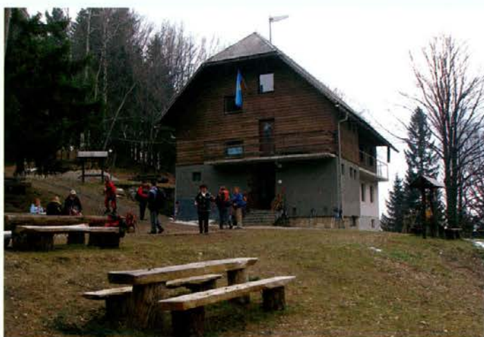
Prvi pohodniki prihajajo na kočo pod Kremžarjevim vrhom.