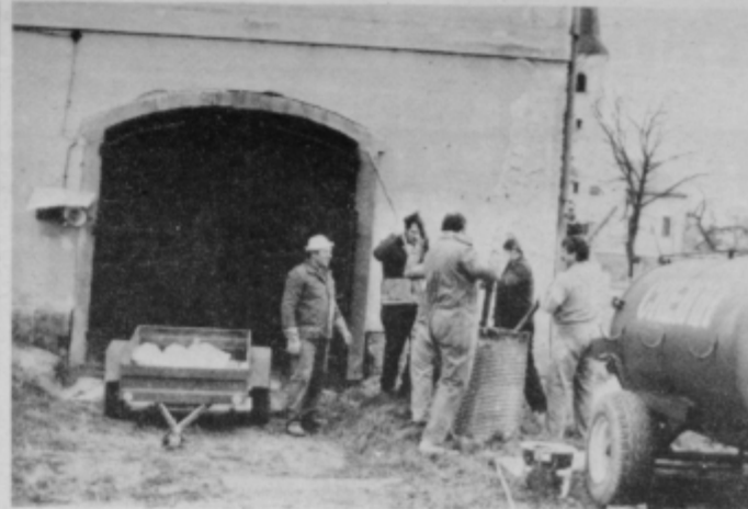
Podvinški gasilci med prostovoljno akcijo beljenja težko pridobljenih prostorov za Karitas.