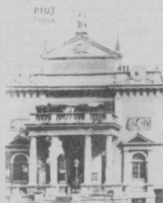
V drugi decembrski številki smo vprašali, kaj je na sliki:

V novem letu bomo nadaljevali akcijo »Nagradno turistično vprašanje«. Pokrovitelj bo Turistično-kulturnoinformacijski center, ki ima sedež v preurejenem mestnem stolpu. Ta bo skrbel za kulturno-turistični marketing, organizacijo in koordinacijo kulturno-turističnih prireditev, oblikovanje in prodajo turističnih programov, informacijsko-vodniško dejavnost ter oblikovanje in uresničevanje promocije ptujske kulturno-turistične ponudbe. Po sklepu izvršnega sveta bo delo TKIC-a začasno opravljal Pokrajinski muzej Ptuj.