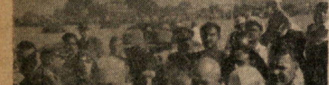
Tov. Hrusčev in Bulganin v Novem Delhiju, kjer sta bila dežna prav tak prisrčnega sprejema kot v vseh drugih mestih Indije, ki sta jih obiskala.

menzi Tehnološkega inštituta svoje shajalec.