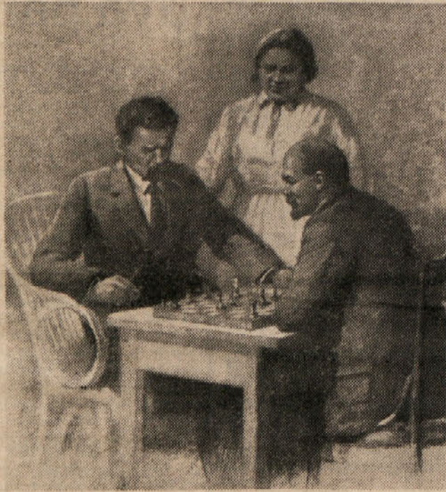
Lenin 1922 leta skupno z Gorkim in Krupskajo.