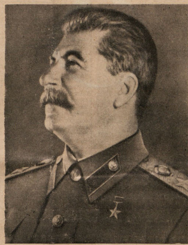
21. decembra poteka 76-letnica rojstva velikega voditelja sovjetskega ljudstva v dobi izgradnje socializma, v domovinski vojni proti nacifašizmu in v povojni obnovi ZSSR Josipa Visarjonoviča Stalina. Stalin je skoraj 30 let vodil sovjetsko državo in Komunistično partijo Sovjetske zveze. Za časa njegovega vodstva je ZSSR postala ena izmed najmodernejših industrijskih držav z najmodernejšim poljedelstvom. Postala je svetilnik za vse delovne ljudi sveta in borbi za boljše življenje in odpravo izkoriščanja. Stalin je bil bojni tovariš velikega Lenina in je uresničitelj nesmrtnih Leninovih naukov.

Zato ta okrožnica učinkuje na Tržaškem tudi kot diskriminacija proti slovenskemu življenju, ki je v svoji ogromni večini sestavljen iz revnih ljudi. Vsi tisti, ki so bili pogojno kaznovani in jim je bila ta kazen črtana iz kazenskega lista, ki so bili v svoji ogromni večini sestavljeni iz revnih ljudi. Vsi tisti, ki so bili pogojno kaznovani in jim je bila ta kazen črtana iz kazenskega lista, ki so bili v svoji ogromni večini sestavljeni iz revnih ljudi. Vsi tisti, ki so bili pogojno kaznovani in jim je bila ta kazen črtana iz kazenskega lista, ki so bili v svoji ogromni večini sestavljeni iz revnih ljudi. Potrebnost je torej, da se čim močneje dvigne ljudski glas proti tej diskriminaciji. Med Slovenci pa naj se dvigne glas vseh skupin in strank, da se prepreči nov način diskriminacije na škodo slovenskega prebivalstva, ki je že itak oskudovano v vseh pogledih. Primer zgoniške občine nas spet, da odločno zahtevamo odpravo Scelbove okrožnice, če nečemo, da se na podlagi sme-