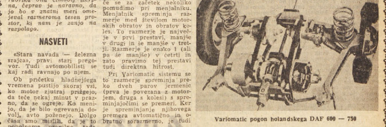
Variomatic pogon holandskega DAF 600 - 750

Menimo, da ne bo odveč, če se za začetek nekoliko pomudimo pri menjalniku. Menjalnik spreminja razmerje med številom motorjskih obratov in obratov koles. To razmerje je največje v prvi prestavi, manjše v drugi in še manjše v tretji. Razmerje je enako 1 (ali pa še manjše) v četrti in zato pravimo tej prestavi tudi direktna hitrost.