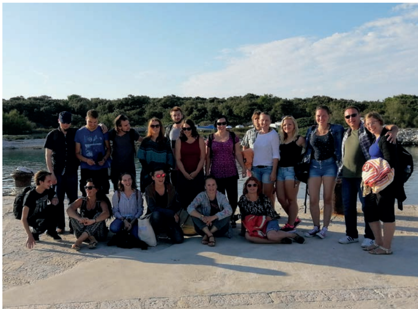
Skupinska fotografija vseh seminaristov po celodnevem izletu na otoku Silba