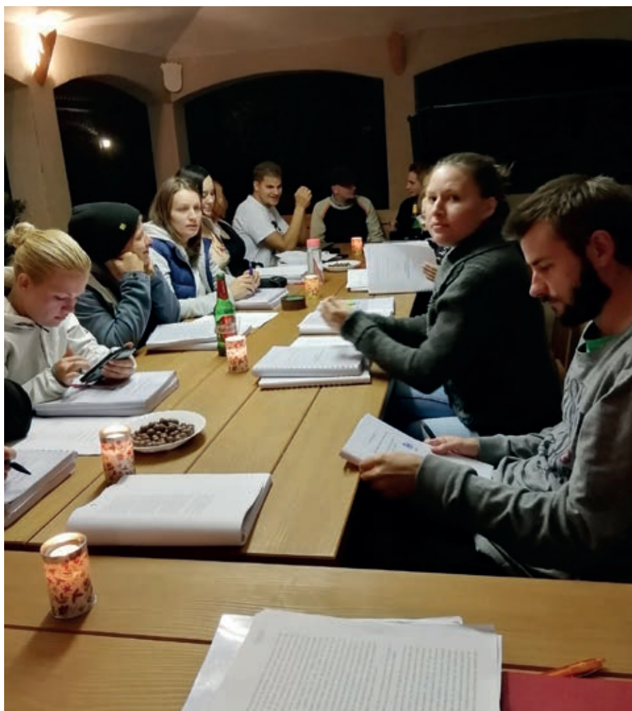
Večerna branja in skupinska diskusija

Seminarist odda zadnji dan svoje končne verzije prevodov, ki jih po tem ne more več popravljati, saj bi bila povratna informacija, prejeta samo na koncu seminarja, pedagoško neustrezna. Povratna informacija o delu, ki ga je opravil seminarist, omogoča dvig njegovega občutka kompetentnosti ali prepričanja posameznika, da bo uspešno opravil določeno nalo-