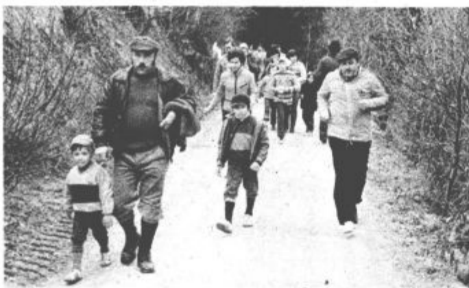
Za zdravo telo

Graški gori trajalo do poznega popoldneva.