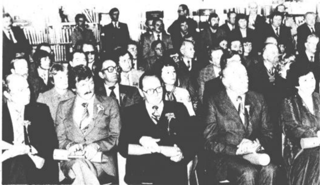
V galeriji knjižnice so slovesno podelili letošnja srebrna priznanja OF in srebrne znake sindikatov