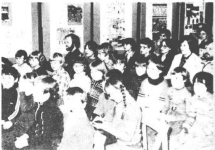
Učenci so s svojo domišljijo na risalnih listih »spregovorili« o pomenu 1. maja.

Ob koncu te tradicionalne akcije so pripravili tudi kulturni program za vse, ki so sodelovali v akciji.