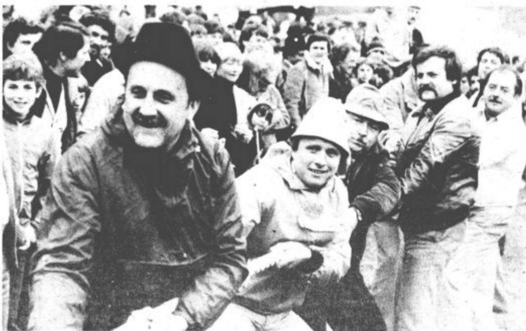
Takole »napeto« je bilo na Graški gori