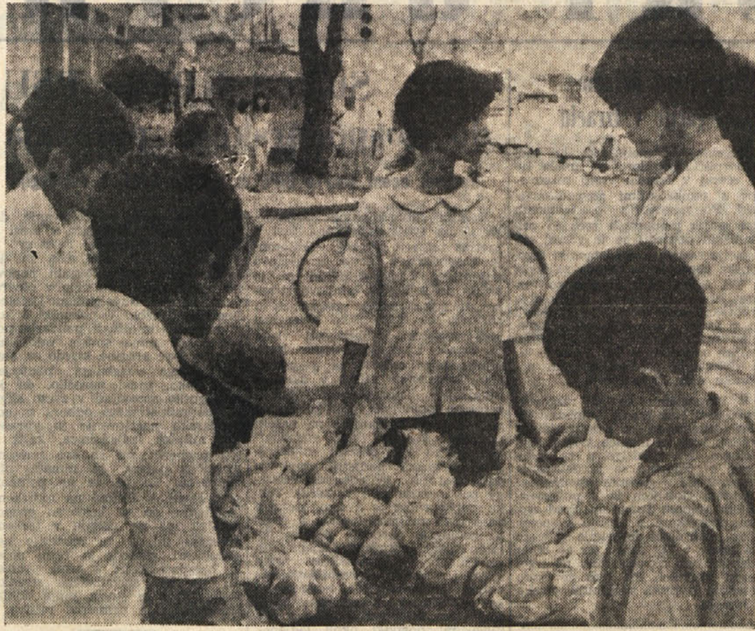
Ofenziva osvojiteljskih sil v Sajgonu je povzročila vrsto zmedenosti pri razdeljevanju živil. Črni borzjanci so to izkoristili in močno dvignili cene. Cena riža je narasla od 20 na 60 piaster za kilogram, cena zelenjave pa se je podvojila.