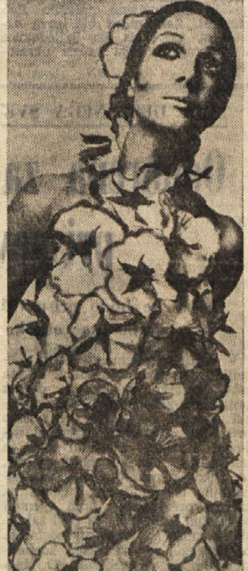
Pravijo, da v modi ni več zakonov, da je moderno, kar nekoli moški pristaja. Kreator Francesio je za zahtev večer pripravil gornji model, ki ima za vzorec makov cvet na organzi

različna in deljena tako na eni, kot na drugi strani. Nekateri so za kravato, ker pritrjuje, da sploh ni mogoče govoriti o moški eleganci brez tega sestavnega dela, do sedanja moške garderobe, drugi pa seveda menja, da se je kravata preživela in da je že čas, da se tudi moški opredelijo za bolj praktično modo, ki kravate ne more upoštevati. To svojo trditve utemeljujejo z dejstvom, da je kravata iz poletne moške garderobe tako rekoc že izgubila in bi bilo zato nesmiselno, da bi jo nosili moški se uporabljati v jeseni in zimi in seveda ob svečanostnih priložnostih. Tisti, ki so trdili da je moda področje samo za ženske in da so moški preveč «resni», da bi se s takimi «neumnostmi» ukvarjali, so tako postavljeni na laž. Če so ženske že borijo za svoje pravice na vseh področjih javnega življenja, si hočejo tudi moški dokončno priboriti pravico, da bodo tudi v zadevah moškega protako muhasti in nezahvalni kot so ženske. In če se spominimo oblačil, ki so jih pred stoljetji, pa tudi ne tako daleč nazaj, nosili moški, potem moramo ugotoviti, d' sploh ne gre za nobeno novost, temveč celo za nekaj povratek v preteklost.