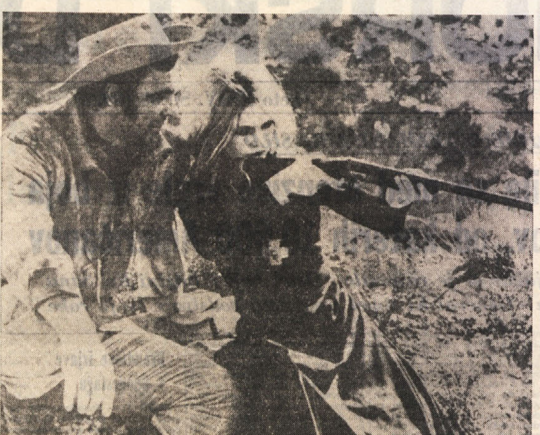
Brigitte Bardot se vadi v streljanju s puško: učil pa jo sloviti Sean Connery, seveda le v filmu «Shalako», ki ga snemajo v Španiji