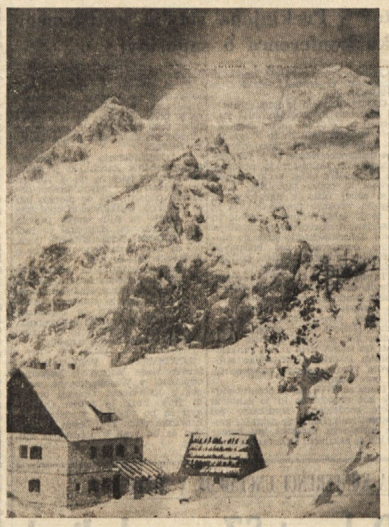
Južno pobočje Triglava nad Vodnikov kočo na Velom polju: tu so se srečali reševalci in pogumna trojica, ki je premagala Čopov steber, dosegla Dom na Kredarici in se potem spustila nazvala

Louis Armstrong se je kmalu nato odpravil na letališče «Leonardo da Vinci», kjer se je vkrcal na letalo, s katerim se je odpravil v ZDA.