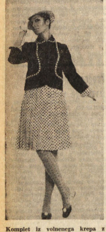
Komplet iz volnena krepca z zelo mladostnim pikastim vzorcem. Belo krilo z modrimi pikami je rahlo nabrano; jopica enotne modre barve je kratka, nekoliško se prilagajajoča, s pikčastimi zavijki. Tudi na klobučku se pike ponavljajo. Belomodri ševji Mannori. Bele najlonske nogavice z modrimi pikami. Model GUIDI.