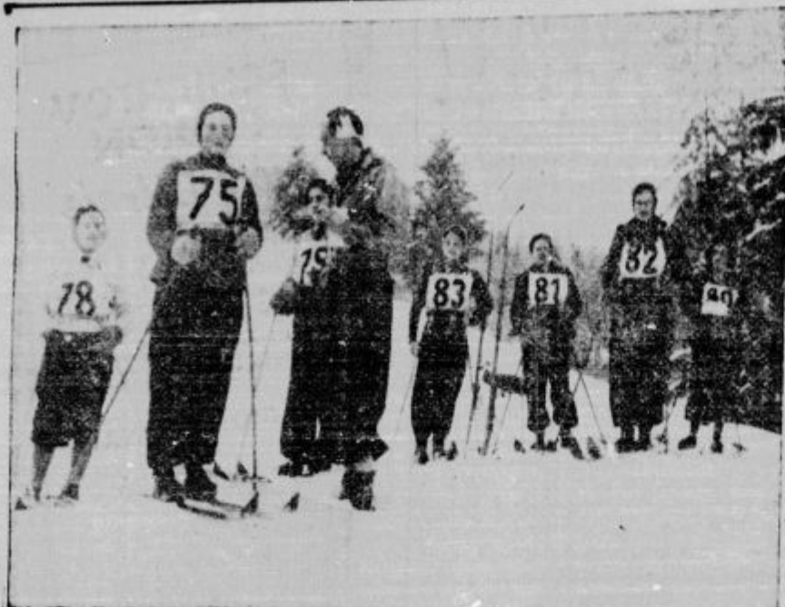
II. smučarske tekme Zveze dekliških krožkov v Bohinju. Članice so pripravljene na progi za smuk.