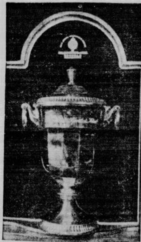
Dr. Korošec je poklonil zmagovalcu smučarskih tekem v Črnem vrhu nad Jesenicami lep pokal.

Ker so vsi finski učitelji poklicani v vojaško službo, bodo poslali Švedi učitelje za 100.000 finskih otrok.