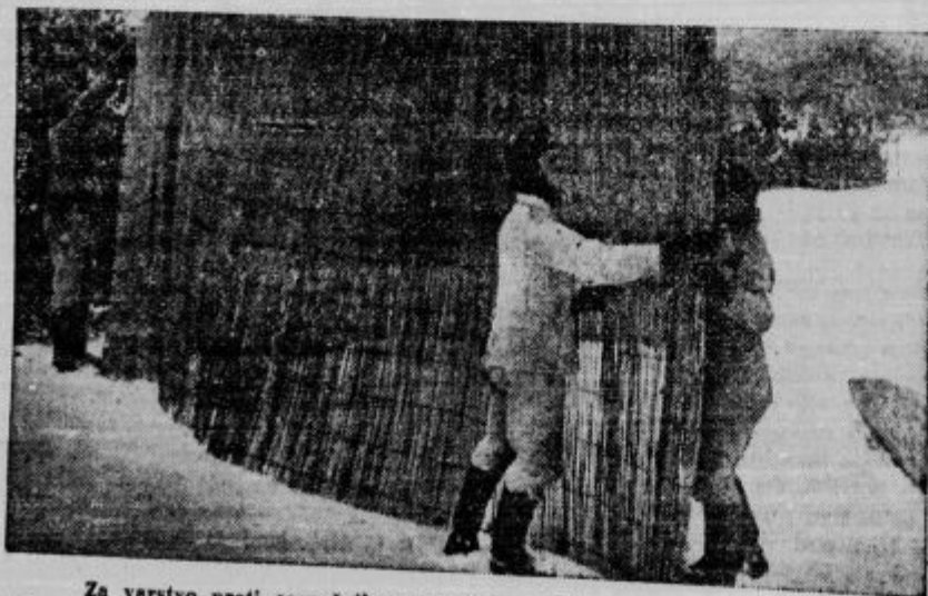
8. Za varstvo proti sovražnikom narejajo vojaki takala kritja iz rogoznic.