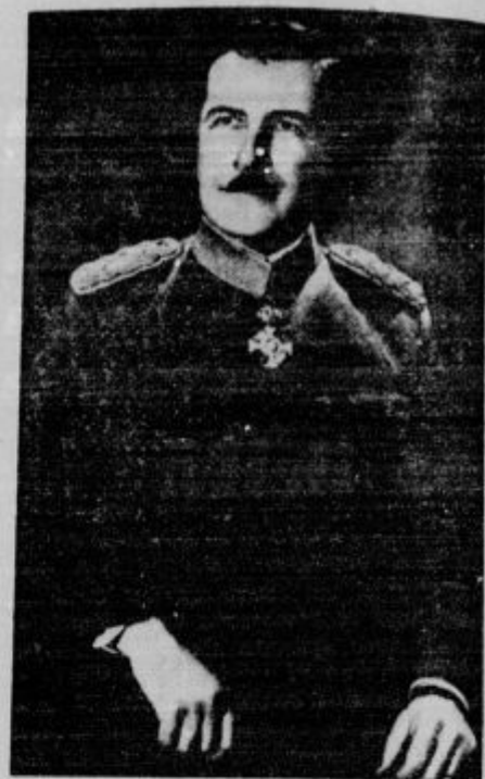
Armadni general Bogoljub Ilić je bil imenovan za vrhovnega inšpektorja vse jugoslovanske oborožene sile.