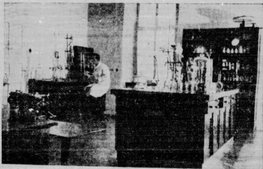
Glavna soba mestnega laboratorija za preizkušanje živil v Ljubljani.